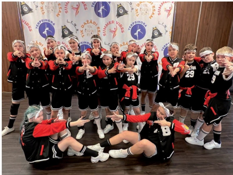
grupas „Jumpers” izaugsmi un panākumus, kas sniedz pozitīvu piemēru gan vietējai sabiedrībai, gan visiem jauniešiem, kuri aizraujas ar deju un mākslu.

Līvānu Bērnu un jauniešu centrs ar lepnumu atzīmē deju