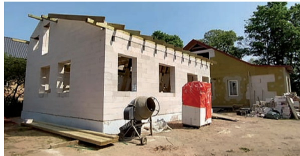
Kausēšanas darbnīca pirms un pēc renovācijas