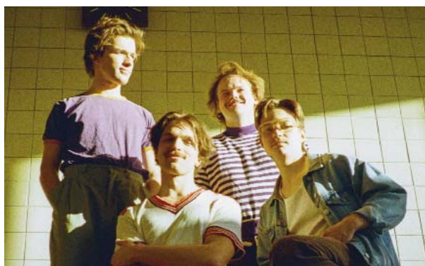
■ Grupa “Carnival Youth”

Vakaru turpinās grupas “Labvēlīgais tips” un “Carnival Youth” koncerti. Nakts balle ar grupu “Dakota” un DJ MC Arti Skrūzmani .