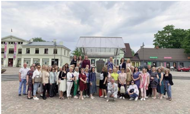
■ Reģionālās attīstības centru apvienības attīstības speciālistu tikšanās Dobelē

Biedrība "Reģionālo attīstības centru apvienība" ir dibināta 2015. gadā ar mērķi apvienot 21 Latvijas Republikas novadu, kas Latvijas Republikas Nacionālajā attīstības plānā definēti par reģionālajiem attīstības centriem, lai nodrošinātu biedru sadarbību vienota viedokļa formēšanā attīstības, tiesiskajos, kā arī citos kopīgos jautājumos un biedru interešu pārstāvību attiecībā ar privātām un publiskām institūcijām valsts un starptautiskā līmenī.