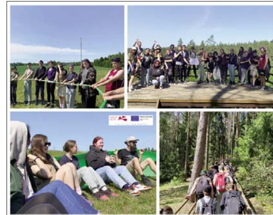
■ Līvānu novada jaunieši veselības dienas aktivitātēs

Pārgājieni bija aizraujoši un saliedējoši – jauniešus sagaidīja arī tādi uzdevumi, ko bija iespējams pārvarēt tikai sastrādājoties komandā.