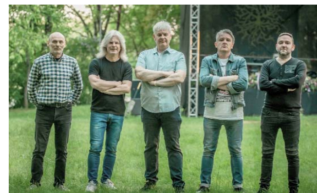
■ Grupa “Dakota”