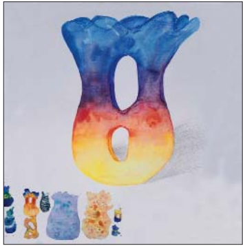
■ Keitijas Daukstes skice traukam “Dabas stihijas”