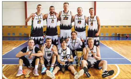
■ Līvānu novada atklātā basketbola čempionāta uzvarētājkomanda “Egles dēls”

Apsveicam godalgoto vietu ieguvējus. Paldies komandām par dalību, paldies galvenajam ties-