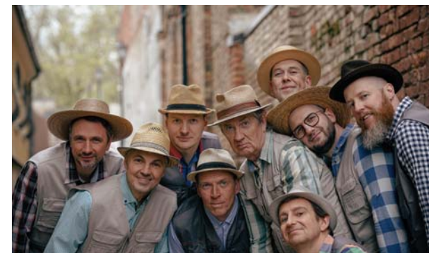
■ Grupa “Labvēlīgais tips”

Priecāsimies arī par labiem padomiem un ierosinājumiem – zvani vai raksti: 26576513 (Aija).