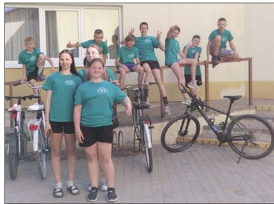
■ Līvānu BJSS audzēkņi sporta nometnē “Soli pa solim izaugsmei”

Paldies Līvānu novada pašvaldībai par finansējumu, Līvānu Bērnu un jaunatnes sporta skolai par organizēšanu, biedrībai “Atbalsts Līvānu novada bērniem” par krekliņiem, Kokneses sporta centram un peldbaseinam par bāzi, pavārtēm