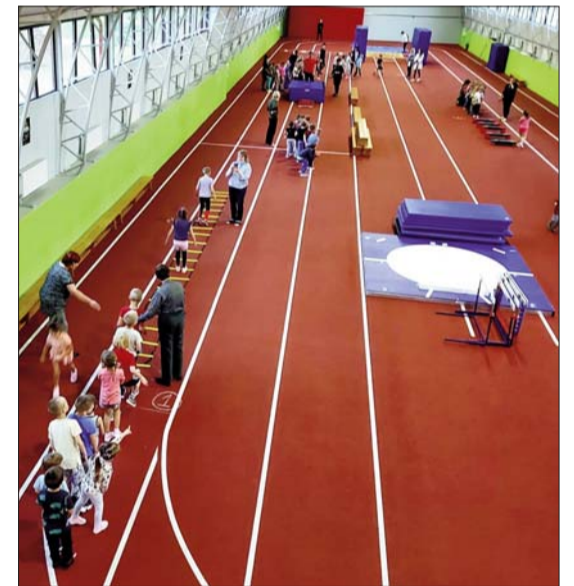
Sporta pasākums "Lēciens rudenī" bērnu dārzā bērniem

garumā, ko bērni veica ar lielu azartu un prieku. Pēc pasākuma visi dalībnieki bija gandarīti un priecīgi, un ļoti vēlējas nākt biežāk uz šādiem pasākumiem. Paldies Līvānu 1.vidusskolas direktoram par iespēju izmantot skolas telpas!