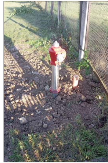
■ Jaunais hidrants Rudzātu pagastā