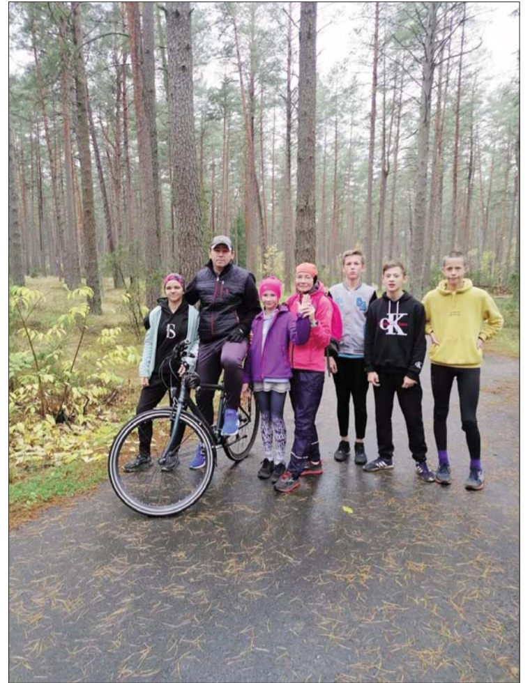
Sporta skolas audzēkņi ar treneriem nometnē Druskininkos

Prieks un gandarījums par labi padarītu darbiņu! Paldies audzēkņiem par pašatdevi un pašdisciplīnu treniņos, vecākiem par atbalstu. Īpašs Paldies Līvānu novada pašvaldībai, Līvānu novada vieglatlētikas klubam un biedrībai "Atbalsts Līvānu novada bērniem" par sadarbību.