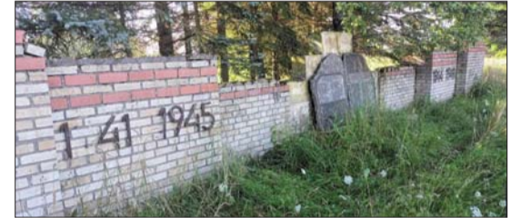
■ Piemiņas plāksne Rudzātu pagastā

Darbus veica SIA "Līvānu dzīvokļu un komunālā saimniecība" atbilstoši 2022.gada 16.jūlija likuma "Par padomju un nacistisko režīmu slavinošu objektu eksponēšanas aizliegumu un to demontāžu Latvijas Republikas teritorijā" 5. panta ceturtais daļas prasībām.