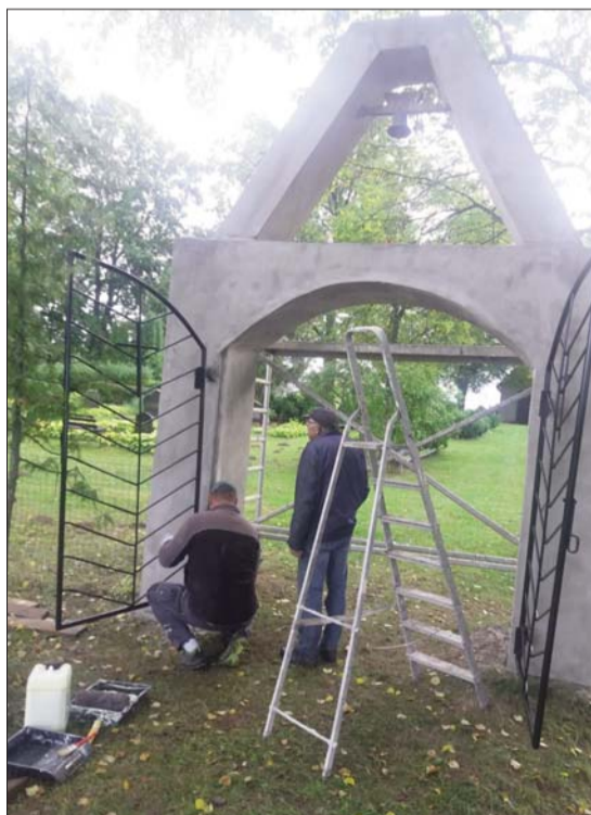
■ Renovētie Šultu kapsētas vārti

Pēc projekta realizācijas vietējā sabiedrībā ir jūtams gandarījums un prieks par kopīgi paveikto. Īpaši liels paldies Līvānu novada pašvaldībai par finansējumu un pagasta komunālajai saimniecībai par atbalstu.