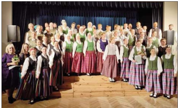
■ Koncerta "Deju virpuli" dejotāji

Oktobris Jersikā pagājis, gatavojoties ziemas sezonai. Komunālās saimniecības strādnieki nosiltināja ūdensvadu, ūdens skaitītājus pašvaldībai piederošajās ēkās un daudzdzīvokļu mājas koplietošanas telpās. Operatīvi tika novērsta ūdensvada avārija Liepu ielā, kur bija plūsusi caurule. Upenieku ciemā ūdensvads ir būvēts pirms vairāk kā 30 gadiem, tāpēc ir bieži bojājumi. Pašu spēkiem nomainītas caurules garākajos ūdensvada posmos. Dzeramā ūdens kvalitāte Upenieku ciemā ir uzlabojusies, jo rekonstruēta atdzelžošanas stacija. Strādnieki regulāri seko noteikumu attīrīšanas iekārtu darbībai Upeniekos un pie Jersikas pamatskolas.