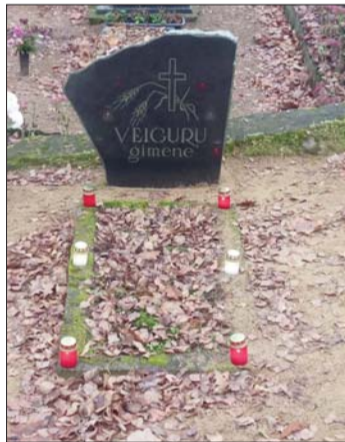
■ Lāčplēša Kara ordeņa kavaliera atdusas vieta Veiguru kapsētā