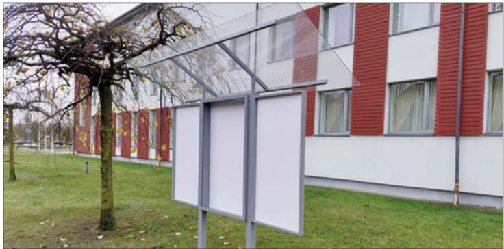
■ Atjaunotais afišu stends

Paldies Līvānu novada pašvaldībai, nodibinājumam "Viduslatgales pārnovadu fonds" un Līvānu novada Kultūras centram par finansējumu un palīdzību šī projekta realizācijā!