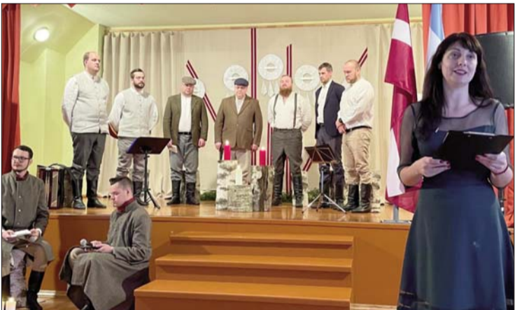
■ "Rūžupis veiri" koncertā Rožupes kultūras namā

Ir noslēdzies darbs pie AS "Latvijas valsts meži" un Valsts Kultūrkapitāla fonda atbalstītā Līvānu novada Kultūras centra projekta "Partizānu, strēlnieku un leģionāru dziesmu mantojuma apzināšana un saglabāšana no nacionālajiem partizāniem Vanagu, Rožupes un Jersikas apkaimēs".