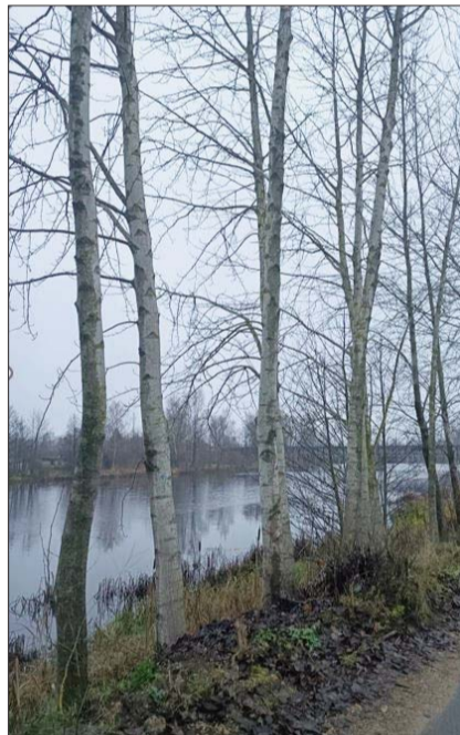
■ Koki Dubnas ielā pretī īpašumam Uzvaras ielā-2b

Pašvaldībā saņemta Dabas aizsardzības pārvaldes Latgales reģionālās administrācijas vēstule "Par koku ciršanu ārpus meža Līvānos", kurā Dabas aizsardzības pārvalde, izvērtējot iesniegto dokumentāciju, esošo informāciju un apsekojot ciršanai paredzētos kokus dabā, konstatēja ciršanai paredzēto koku sugu – baltā apse (Populus alba). Jāpiebilst, ka vizuāli baltās apses un papeles atšķirība ir minimāla (atšķiras koku lapu forma).