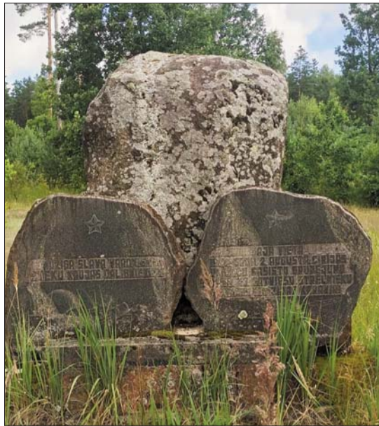
■ Piemiņas akmens Steķu kauju vietā

Līvānu novadā tika demontēti divi padomju un nacistisko režīmu slavinoši objekti – "Piemiņas akmens Steķu kauju vietā" Līvānu novada Turku pagastā uz zemes gabala ar kadastra Nr. 7686 004 0009 un "Piemiņas plāksne" Līvānu novada Rudzātu pagastā uz zemes gabala ar kadastra Nr. 7668 007 0070.