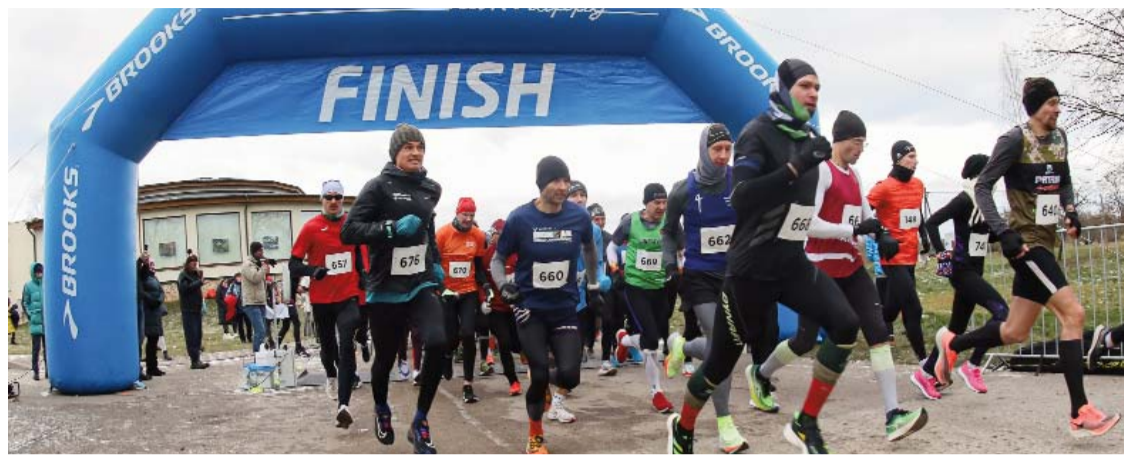
Starts 6.Līvenhofas skrējienam