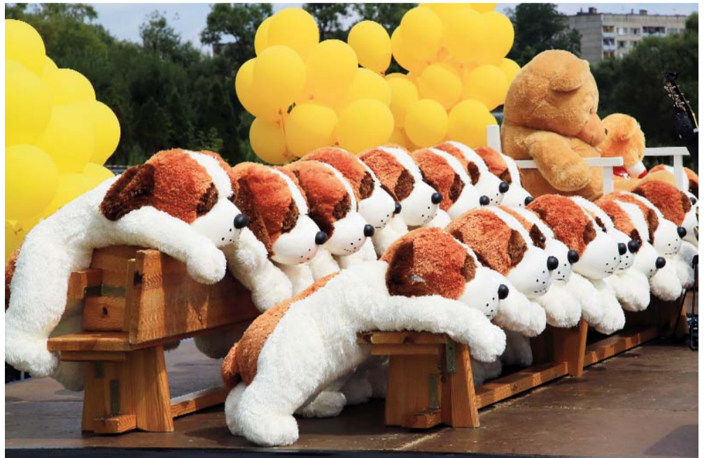
Foto no 2018.gada Bēbišu svētkiem.

Graubiņa Līvānu Mūzikas un mākslas skolā (maznodrošinātām ģimenēm) – ja skolā no vienas maznodrošinātas ģimenes vienlaicīgi mācās vairāki bērni: par otro bērnu maksa ir 50 % apmērā, par trešo bērnu maksa netiek noteikta.