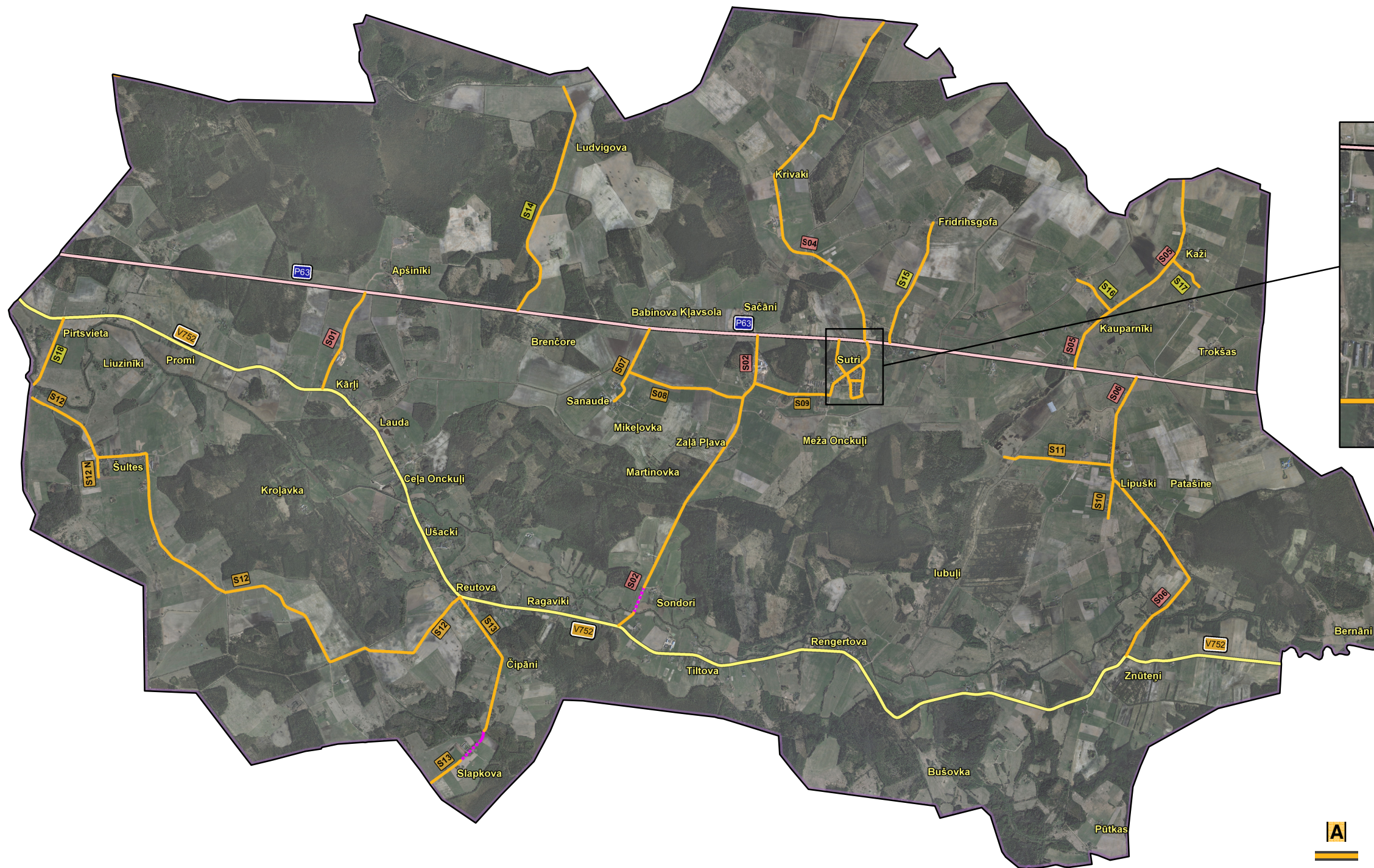
Sutri, M 1:10 000