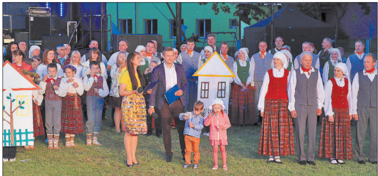
Концертная постановка пятничного вечера была предназначена всех, кто действительно город Ливаны считает своим домом