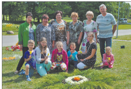
Создание цветочной волны у Центра искусства и ремесленничества Латгалии является давней и доброй традицией. Тема этого года – Солнце