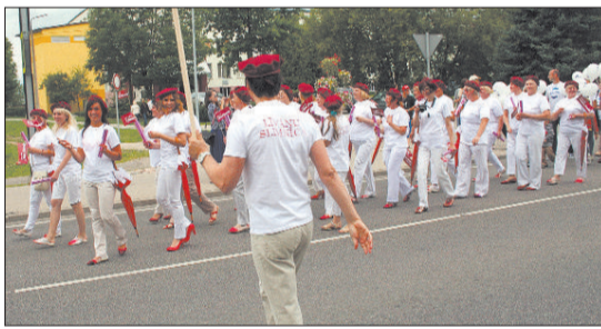
Ливанчане и гости города к праздничному шествию серьезно готовились. Спасибо всем коллективам учреждений, предприятий, художественной самодеятельности и всем, кто участвовал в шествии за творческое оформление своего коллектива и посвященное для этого время!