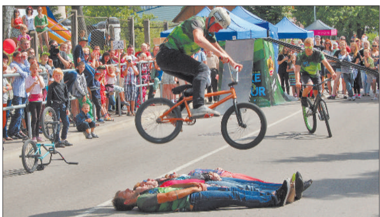
Ребята из команды Greentrials показали захватывающие дух велотрюки, в т.ч. – с участием смелых зрителей