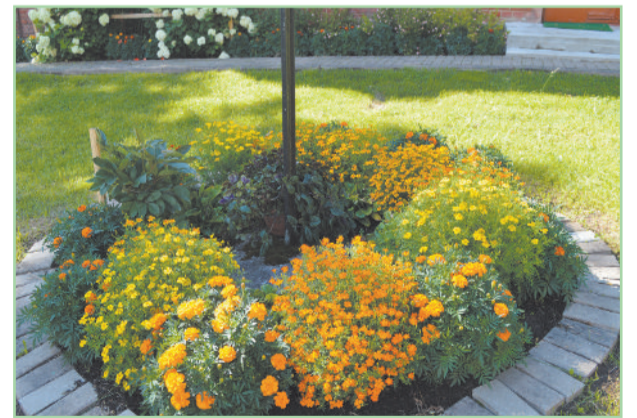
Знотиньская Римско-католическая церковь Богоматери в Сутрской волости

Дума Ливанского края благодарит всех хозяев, которые добродушно согласились принять представителей комиссии и показать свои сады. Как известно, участников конкурса часто заявляют друзья, соседи и знакомые, поэтому для некоторых хозяев это становится сюрпризом. Спасибо, что согласились поделиться красотой, которую создаете своими руками.