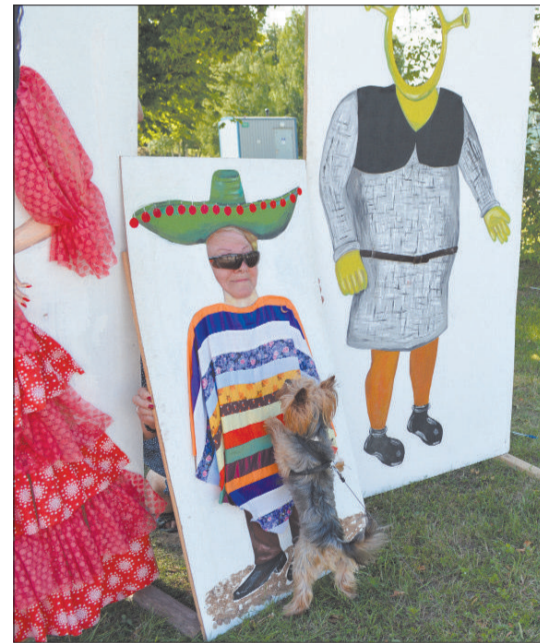
На игровой улице можно было сделать "Прическу Аспазии", в "Мастерской галстуков Райниса" научиться завязывать галстук, покататься на лошадиной повозке, дуть пузыри, разрисовывать стулья и лица, наблюдать за кикбоксингом и парадом уличных танцев, сфотографироваться у фотостенки. Веселые занятия увлекли не только малышей...

До встречи на следующем празднике города, когда будем отмечать 90-летие г. Ливаны!