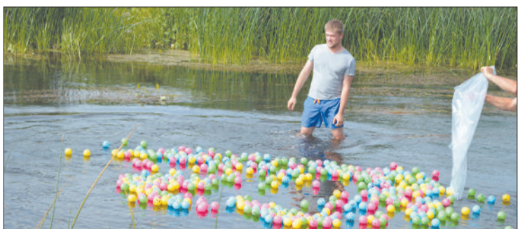
Благотворительное ралли мячей: во время старта ралли все пронумерованные мячи одновременно были высланы в реку Дубну, и началась борьба за призы! Вырученные средства будут направлены на благотворительную цель – на конкурс проектов молодежных идей