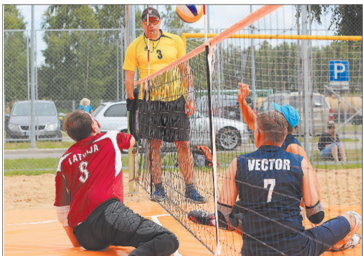
Упорная борьба на турнире по волейболу сидя на спортивной площадке МИЦ "Kvartāls": сборная Латвии против российской команды "Vector". Победа за нами