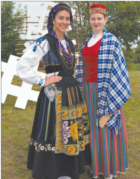
На международном фольклорном фестивале "BALTICA 2015" на концерте дня Латгалии "GASTEJAM LEIVŌNUS" встретились различные культуры: латыши и португальцы