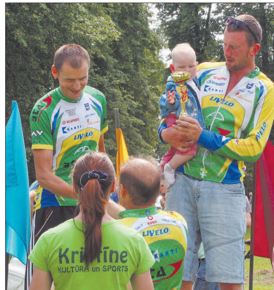
Награждение победителей велосоревнований „Līvāni MTB Maratons 2015“. Рады даже самые маленькие болельщики