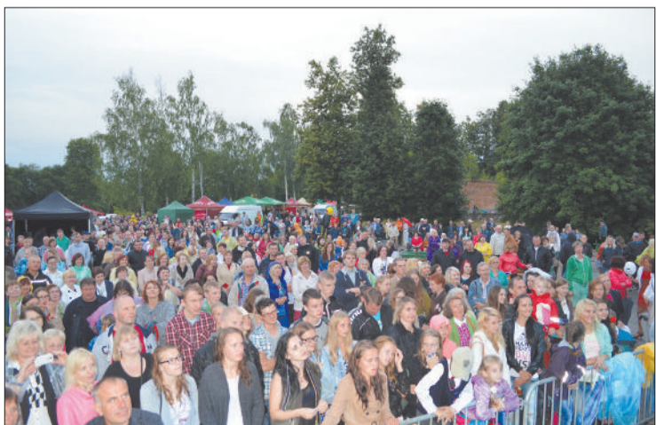
Главный день праздника на площади Традиций каждый год собирает большое количество людей