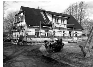
Реконструкция Зунданского Дома Культуры