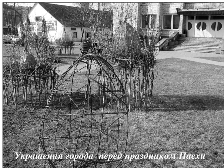
Украшения города перед праздником Пасхи