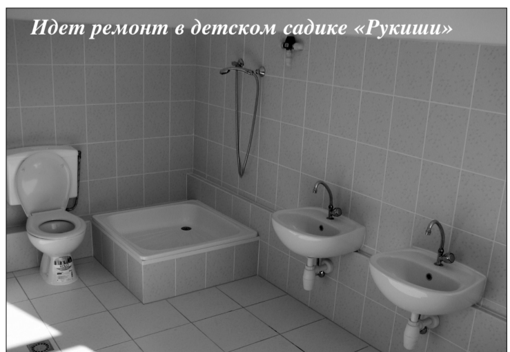
Идет ремонт в детском садике «Рукиши»