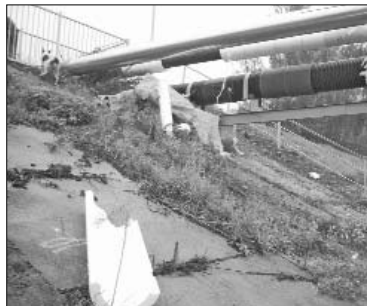
Atkal nepatīkami mirkļi jāpiedzīvo tiem, kas dodas pāri gājēju tiltam Līvānos - vandāļi norāvuši trašu siltināšanas materiālu...