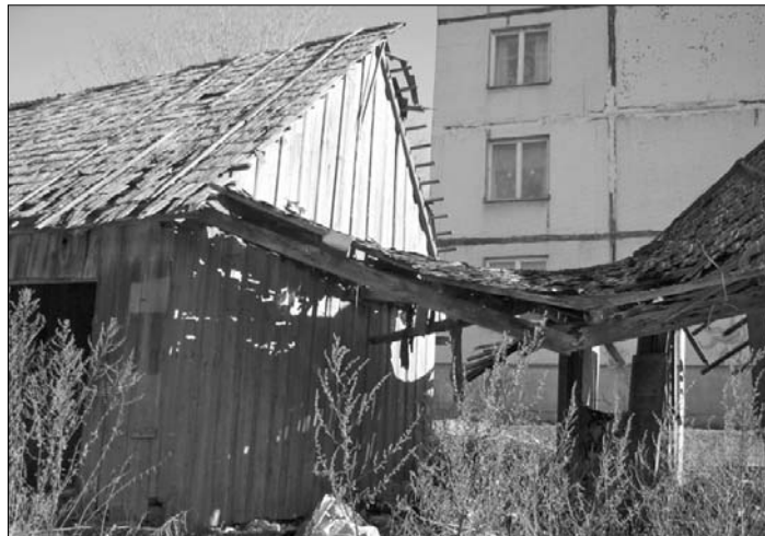
Līdzās ēkai slējās pussagruvuši šķūņi, uz kuriem katru rītu bija spiesti skatīties Saules ielas 12 nama iedzīvotāji

Dīvstāvu mājas grausts Rīgas ielā 22, Līvānos kā atbaidošs rēgs centrālās ielas malā lika šausmināties garābraucējiem, un apdraudēja gājējus, īpaši bērnus. Dome jau vairākus gadus saņēma iedzīvotāju sūdzības par šo bīstamo ēku, diemžēl visus pašvaldības lūgumus ēku sakārtot, tās īpašnieks atstāja bez ievēribas. Pašvaldībai neatlika cita iespēja, kā iet juridisko ceļu, nojaucot ēku piespiedu kārtā.