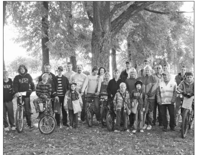
20. septembrī Līvānos notika Eiropas Mobilitātes dienai veltīts velomaratonis, kuru organizēja veloklubs Līvāni un novada dome. Nedēļas ietvaros norisinājās aktivitātes skolās, un ikvienam interesentam bija iespēja iegūt velosipēdistu vadītāja tiesības. Tagad uz ielām un ceļiem būs par 100 (tik cilvēku saņēma velosipēdistu apmācītiem un drošiem velosipēdistiem vairāk. Organizators - Līvānu novada dome saka lielu paldies par balvām sponsoriem, kas atbalstīja Mobilitātes nedēļu: GE Money Bank, Hipotēku banka, SEB banka, Parex banka, SIA "Adugs", Europe Direct, Veloklubs Līvāni.