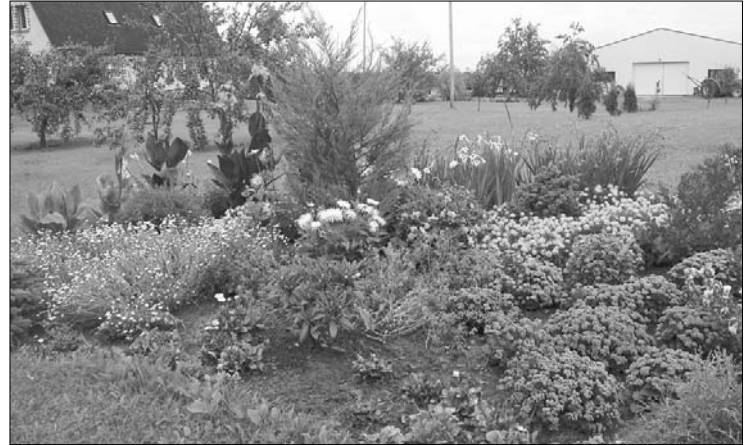
LEONA VAIVODA ģimenes dārzs - plaša un sakopta lauku sēta «Liepas» paveras skatienam Rožupes pagasta Vilmeniešos

Visaktīvākie šogad izrādījušies Rožupes pagasta iedzīvotāji - no šī pagasta konkursā piedalījās četras saimniecības.