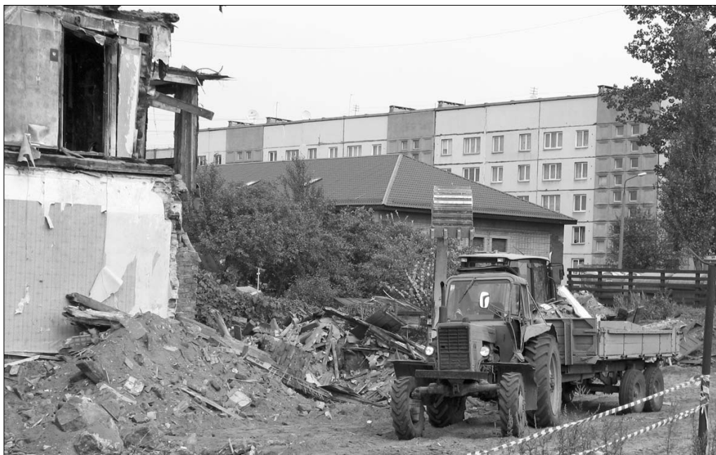
Septembra mēnesī SIA «Līvānu meliorators» veica ēkas nojaukšanas darbus, izveda būvgružus, uzbēra melnzemes kārtu. Ar nojaukšanu saistītos izdevumus dome cer piedzīt no Rīgas ielas 22 zemes gabala īpašnieka

Visbeidzot 2008. gada 26. marta sēdē Līvānu novada dome pieņēma lēmumu par nekustamā