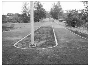
Bet turpat līdzās acis priecē gājēju tilta pievadceļiņi gājējiem un velobraucējiem. Šonedēļ svaigs asfalta segums tiks uzklāts arī Vecticībnieku ielā, kas nu būs viena no skaistākajām Līvānu ieliņām. Skaistā rudens dienā aizejiet, apskatiet!