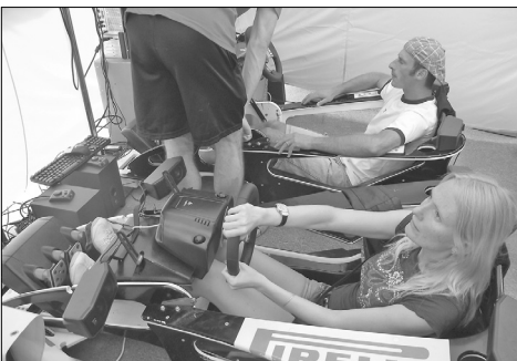
АВТО СИМУЛЯЦИОННЫЕ ИГРЫ – нравятся даже взрослым! Атракцион, который предложило ливанское ООО «AV Motors»