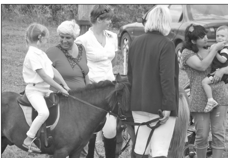
Катание на пони.