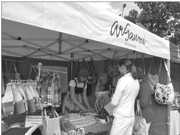
На площади рядом с Центром культуры Ливанского края у предпринимателей Ливанского края и надомных производителей была возможность представить свою продукцию. Также со своим товаром участвовали представители предприятий других городов Латвии