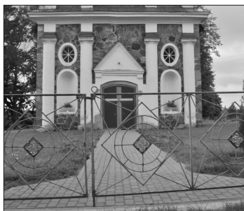
Дорожка на территории Мадалиньской церкви получила новое покрытие