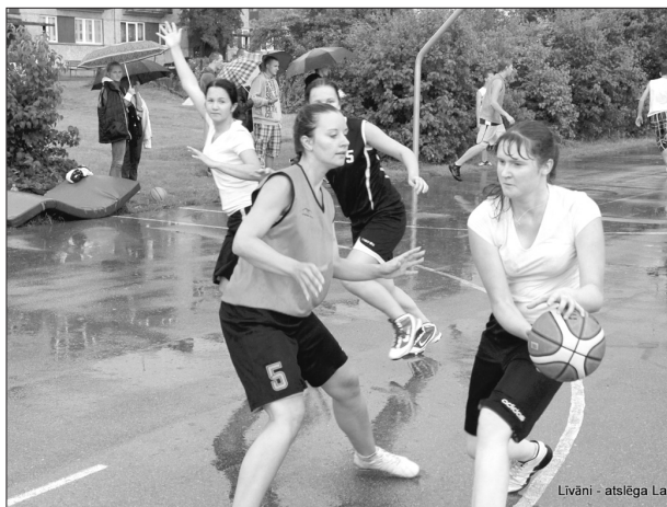
Сильный ливень не помешал участникам стритбола бороться изо всех сил