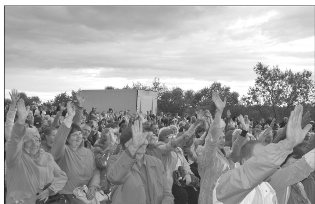
Pilsētas svētku lielkoncerts pulcināja ap 7-8 tūkstošiem skatītāju gan no Līvāniem, gan citiem Latvijas novadiem