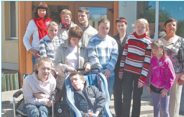
Вместе с классом С уровня обучения Калснавской основной школы «Kārēsi»

С 1 сентября 2005 года в Ливанской 1 средней школе работает класс С уровня обучения, который посещают 4-ро учеников с нарушениями умственного развития.