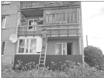
Pilnā sparā rit balkonu apdares materiālu nomaiņa daudzdzīvokļu mājai Jaunsilavas ielā 7, Turku pagastā

ņa un lieveņa segums. Atbilstoši projektā plānotajam ir sakārtota svētavota apkārtnē, uzstādīta norāde «Svētavots», kā arī veikti apzaļumošanas darbi. Interesu grupa saka paldies visiem Līvānu