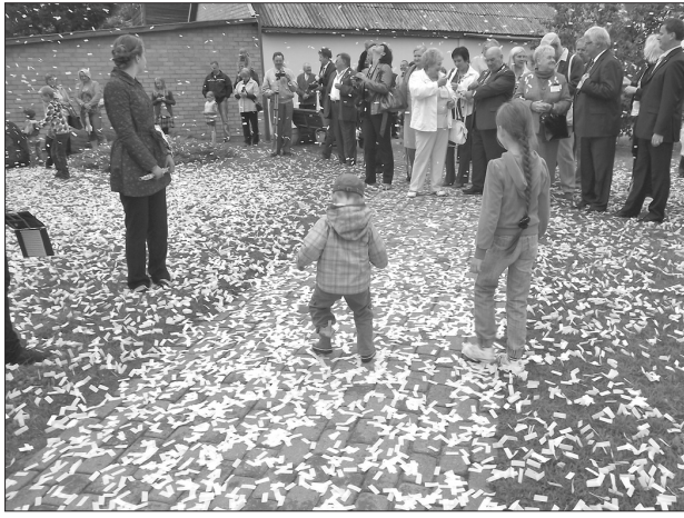
Обильным дождем из конфетти, выступлением группы «Storm» и Ливанского духового оркестра, овациями многих ливанчан и гостей города, у думы Ливанского края состоялось открытие праздника города Ливаны