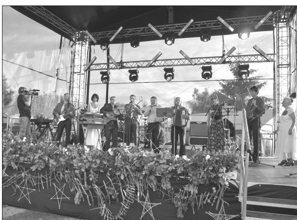
Юбиляры пятничного вечера – капелла «Jūlijs» на концерте своего 25-летия