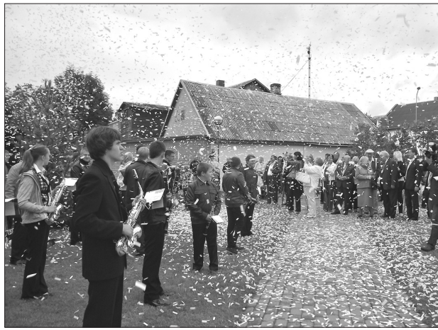
Ar bagātīgu konfeti lietu, ritma grupas «Storm» un Līvānu pūtēju orķestra priekšnesumiem, ar daudzu līvāniešu un pilsētas viesu ovācijām, pie Līvānu novada domes tika atklāti Līvānu pilsētas svētki