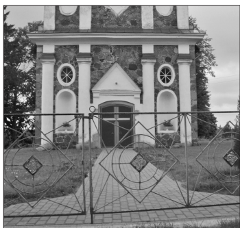
Celiņam Madalienas baznīcas teritorijā uzklāts jauns bruģis