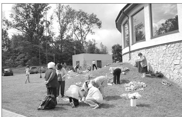
Tā kā šogad Līvānu pilsētas svētki noritēja pie moto «Mirdz zvaigznes jūlija debesīs!», arī Latgales mākslas un amatniecības centra apkaimē par godu pilsētas svētkiem tika iedegtas krāšņas ziedu zvaigznes - uzņēmumi, iestādes draugu/radu kompānijas piepildīja ar ziediem īpaši sagatavotas zvaigznes par godu savai pilsētai – Līvāniem