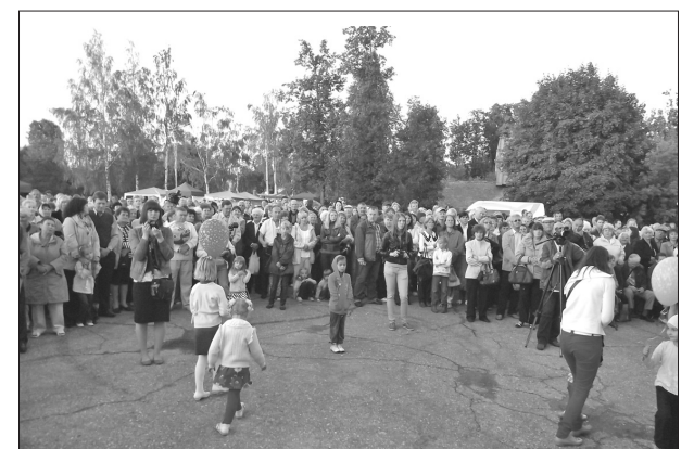
На празднике города радовался и мал, и велик