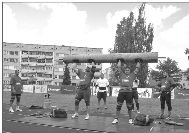
Latvijas spēkavīru čempionāta 2012 dalībniekiem dotie uzdevumi nebija no vieglajiem - bija jānes 570 kg smaga metāla vanna, jāceļ 235 kg smags balķis, 1300 kg smaga automašīna un vairāki citi uzdevumi