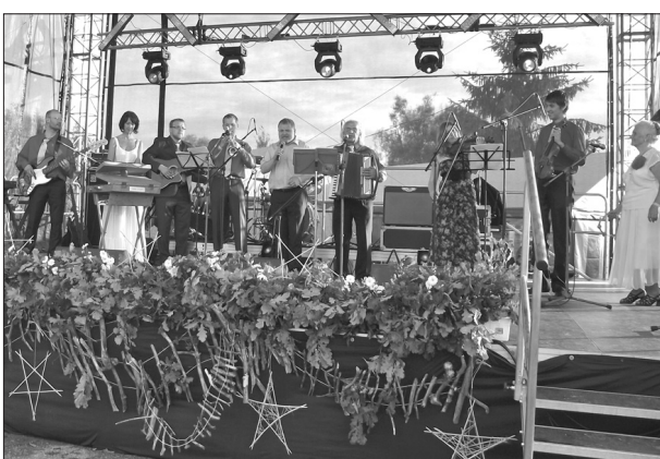
Piektdienas vakara gaviļnieki – kapela «Jūlijs» savā 25 gadu jubilejas koncertā