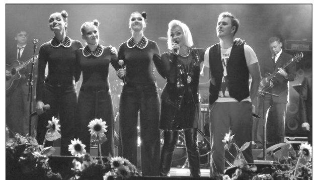
Лайма Вайкуле пела специально для праздника города Ливаны подготовленный репертуар, где были песни и на латышском, и на русском языке – и хорошо известные песни Раймонда Паулса, которые каждый мог подпевать, и менее знакомые песни. Вместе с Лаймой Вайкуле пела группа «Lady's Sweet» и Янис Стибелис