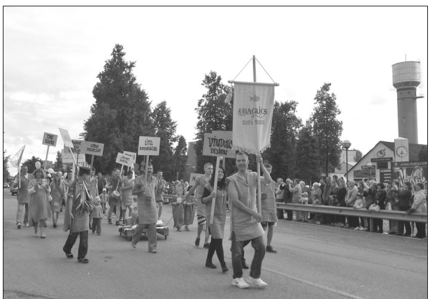
В большое праздничное шествие от краевой думы до площади Традиций отправился коллектив думы Ливанского края, делегации из зарубежных городов-побратимых, участники капеллы «Jūlijs», друзья, бывшие ученики со всей Латвии, коллективы самодеятельности Ливанского края, работники предприятий края и многие другие. Участники тщательно готовились, позаботясь о необычных костюмах и красочном оформлении