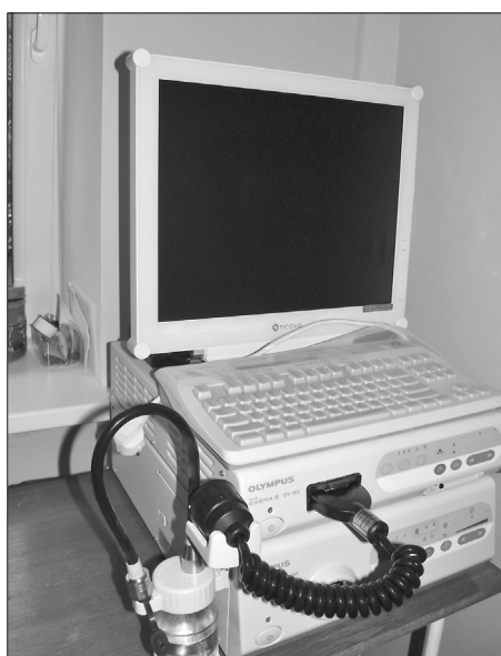
Jaunais Līvānu slimnīcas endoskopijas aparāts

Jau vairāk kā gadu Līvānu slimnīca īsteno Eiropas Sociālā fonda finansēto projektu «Sociālās rehabilitācijas un sociālās aprūpes pakalpojumu attīstība Līvānu novadā». Projekta ietvaros sociālās rehabilitācijas nodaļā ikviens Līvānu novada iedzīvotājs, kuram ir funkcionāli