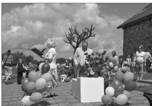
Jau septīto gadu Līvānu pilsētas svētkus kuplina iemīļots pasākums – Bēbišu svētki, ko organizē Līvānu novada Dzimtsarakstu nodaļa. Šoreiz sumināja 2011.gada II pusgadā un 2012. gada I pusgadā dzimušos mazulišus