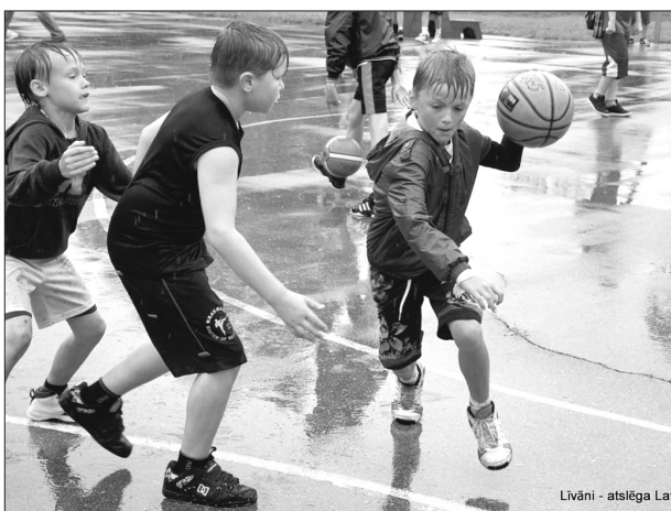
Spēcīgais lietus netraucēja strībola sacensību dalībniekiem cīnīties, cik vien spēka