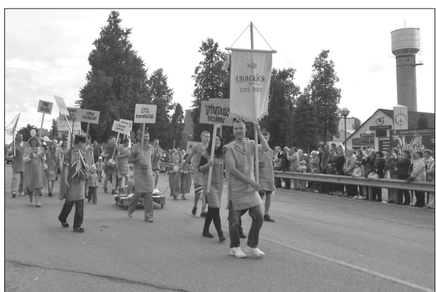
Lielajā svētku gājienā no novada domes līdz Tradīciju laukumam devās Līvānu novada domes kolektīvs, delegācijas no ārvalstu sadraudzības pilsētām, kapelas «Jūlijs» dalībnieki, draugi, bijušie audzēkņi no visas Latvijas, Līvānu novada pašdarbības kolektīvi, novada uzņēmumu darbinieki un daudzi citi. Dalībnieki bija rūpīgi gatavojušies, sarūpējot neparastus tērpus un krāšņu noformējumu