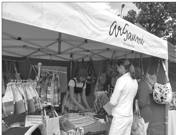
Laukumā pie Līvānu novada kultūras centra Līvānu novada uzņēmējiem un mājrāzotājiem bija iespēja prezentēt savu produkciju, piedalījās arī citu Latvijas pilsētu uzņēmumu pārstāvji ar savu preci