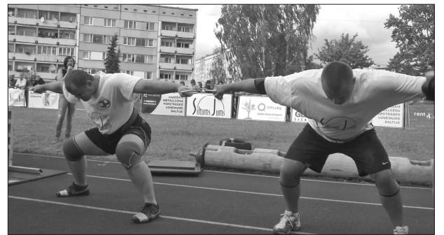
Заданные для участников Латвийского чемпионата силачей 2012 задания были не из легких – надо было нести металлическую ванну весом в 570 кг, поднимать бревно - 235 кг, автомашину - 1300 кг и выполнять многие другие задания