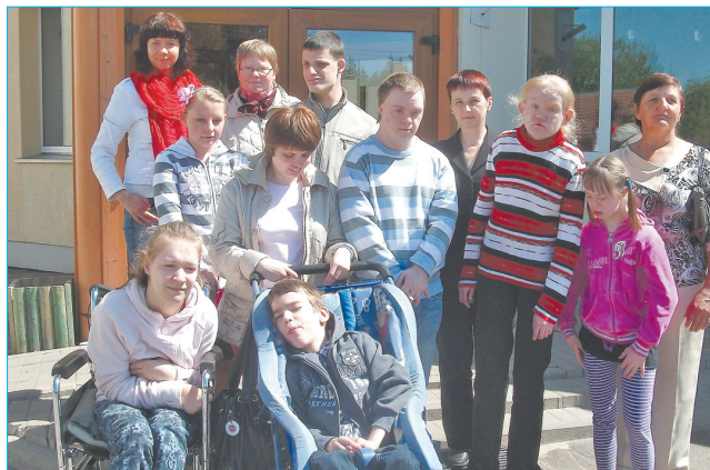
Kopā ar Kalsnavas pamatskolas C līmeņa apmācības klasi «Kāpēcīši»

Kopš 2005.gada 1.septembra Līvānu 1.vidusskolā darbojas C līmeņa apmācības klase, kuru apmeklē 4 jaunieši ar garīgās attīstības traucējumiem.