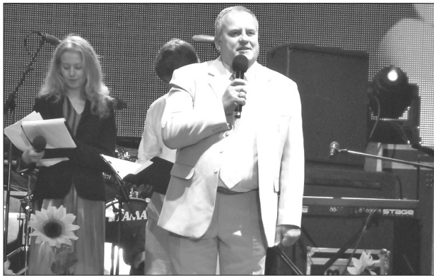
Председатель думы Андрис Вайводс поздравляет жителей с праздником