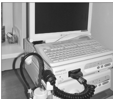
Новый эндоскопический аппарат Ливанской больницы

В рамках проекта создан Дневной центр по уходу для людей с функциональными нарушениями, для людей пенсионного возраста и предпенсионного, а также для детей с функциональными нарушениями. В Дневном центре можно получить и индивидуальные консультации специалистов, и принять учас-