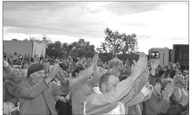
Большой праздничный концерт собрал около 7-8 тысяч зрителей из Ливан, и из других краев Латвии