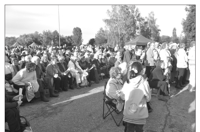
Pilsētas svētkos no sirds priecājās gan lieli gan mazi