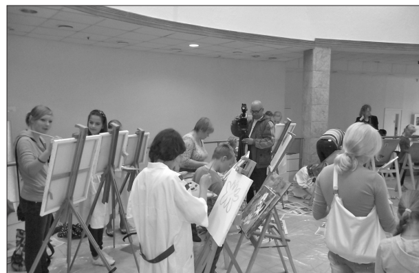
Glezošanas akcijā jeb tautas studijā gleznošanā «Radi gleznu! Esi zvaigzne» varēja piedalīties ikviens Līvānu novada iedzīvotājs vai viesis. Latgales mākslas un amatniecības centru piepildīja krāsu smarža un aizrautīga darba prieks. Glezošanas studijas dalībnieki gleznoja ziedus, iedvesmojušies no visapkārt amatniecības centram izkaisītajām ziedu zvaigznēm, ko iepriekšējā dienā veidojuši tādi paši entuziasti