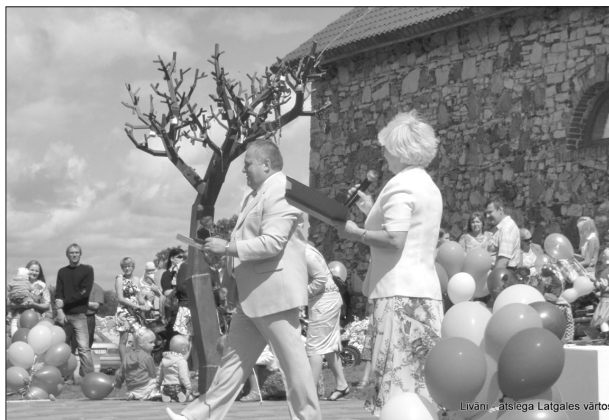
Уже седьмой год праздник города Ливаны дополняет излюбленное мероприятие – Праздник младенцев, который организывает отделение ЗАГСа Ливанского края. На сей раз поздравляли рожденных во II полугодии 2011 года и I полугодии 2012 года малышей