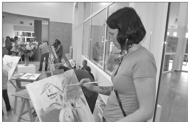
В акции живописи или в работе народной студии живописи «Создай свою картину! Стань звездой» мог участвовать любой житель Ливанского края или гость. Центр искусства и ремесленничества Латгалии наполнил аромат красок и радость увлеченного творчества. Участники студии живописи рисовали цветы, воодушевленные расположенными вокруг центра ремесленничества цветочными звездами, которые днем раньше создавали такие же энтузиасты