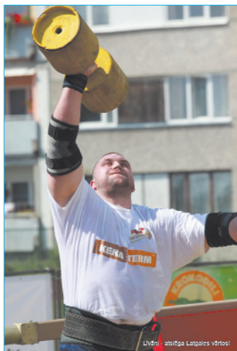
Шоу силачей всегда собирает полные трибуны зрителей. В этом году в Ливанах состоялся один из этапов чемпионата.