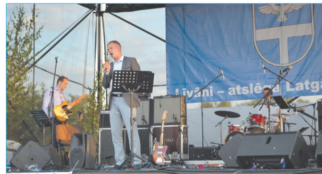
Дайнис Скутелис – солист Латвийской Национальной оперы на праздничной сцене площади Традиций.