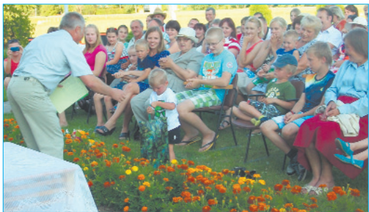
Праздник Сутрской волости собрал много посетителей – радовался и мал, и велик.

„Вот так мы отмечаем праздник... печем хлеб, срываем цветы, и весь двор залит песнями”. Большое спасибо всем, кто помог организовать праздник: Сутрской волостной управе, Сутрской волостной библиотеке, Центру культуры Ливанского края, ООО „Inga”. Спасибо участникам и руководителям коллективов художественной самодельности.