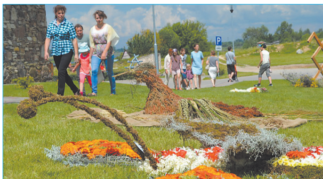
Цветочная волна и акция „Подари цветы своему городу!” проверенные ценности – как и хорошее вино с каждым годом становятся все только лучше.