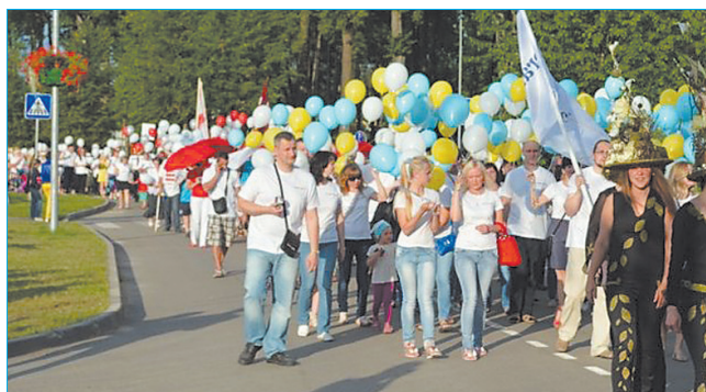
ООО „Biolitec” дополнило шествие многочисленным коллективом и яркими воздушными шарами.