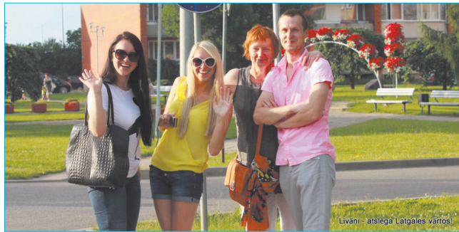
Искренняя радость и на лицах зрителей! Радостных праздников!