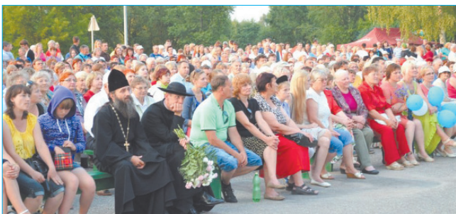
На празднике городе зрителей хватает, ведь вход на все праздничные мероприятия в Ливанах свободный.