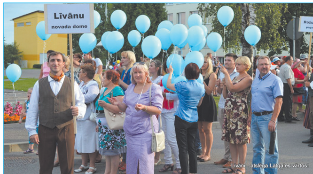
Коллектив думы Ливанского края верен цвету флага и герба города Ливаны – у всех в руках голубые шары!