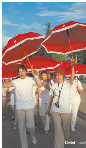
Одно из самых ярких оформлений шествия – у коллектива Ливанской больницы.