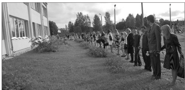
Фото: Приглашаем поддержать нашу инициативу и в честь 25-летия „Балтийского пути” создавать круги дружбы вокруг своих школ, эти события документировать и информацию отсылать Латвийской национальной комиссии UNESCO.

Пусть во всех школах новый учебный год пройдет успешно, деятельно и дружно!