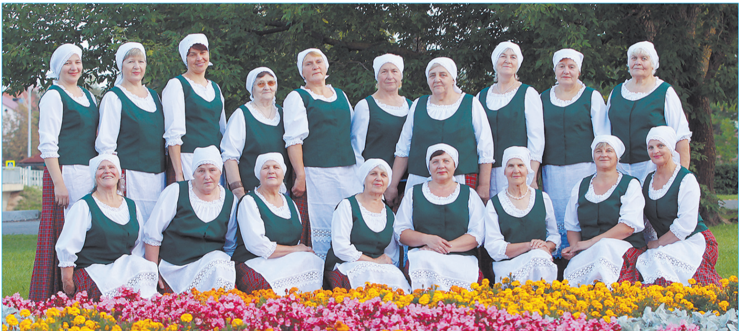
■ Projekta rezultātā sagādātie skatuves tērpi (attēlā deju kolektīvs „Rūņeņas”) radīs motivāciju cēsties vēl vairāk un saglabās dejot prieku ne vien pašiem deju kolektīvu dalībniekiem, bet arī priecēs ikvienu pasākumu apmeklētāju.

Projekta ietvaros veikta sekojošas aktivitātes (veikta skatuves tērpu iegāde 4 dažādiem deju kolektīviem: pirmsskolas deju kolektīvam, kas darbojas PII „Rūķīši”, sākumskolas 3.klašu deju kolektīvam, TDA „Silava” un senioru deju kolektīvam „Rūņeņas”): 24 puīšu un meiteņu Krustpils nova-