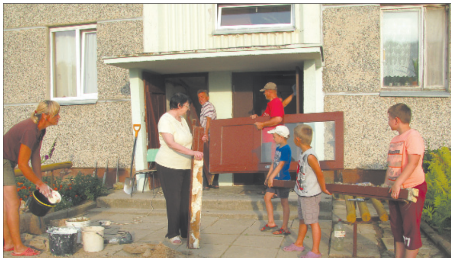
■ Инициативная группа благодарит думу Ливанского края за организацию конкурса проектов и финансовую поддержку, а жителей дома за отзывчивость и вложенный труд.

Радуется то, что даже жители волостных многоквартирных домов общими усилиями могут сделать очень многое по содержанию и благоустройству своих домов. Пусть в Ливанском крае будет больше ухоженных многоквартирных домов!