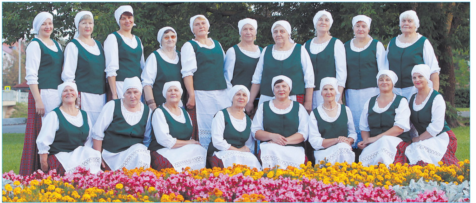
■ В результате проекта приобретенные сценические костюмы (на снимке танцевальный коллектив „Rūžēpas”) послужат мотивацией стараться еще больше и сохраняют полученную от танца радость не только для самих участников коллективов, но и порадуют каждого посетителя мероприятия.

Проект осуществляется в рамках объявленного обществом „Preiļu rajona partnerība” конкурса Программы сельского развития на 2007-2013 год, 413 мероприятие 4 оси “Разнообразие сельской экономики и способствование качеству жизни и территориях местных стратегий развития”.