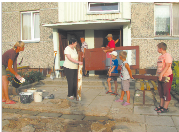
■ Iniciatīvas grupa saka paldies Līvānu novada domei par projektu konkursa organizēšanu un finansiālo atbalstu, mājas iedzīvotājiem par atsaucību un ieguldīto darbu.

Priecē tas, ka arī pagasta daudzdzīvokļu māju iedzīvotāji kopīgiem spēkiem var paveikt daudz savu māju uzturēšanai kārtībā