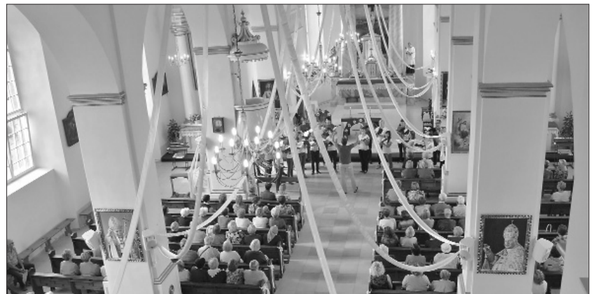
■ Divus gadus ilgais remonts Līvānu Romas katoļu baznīcā noslēdzies.

Lai kāda būs jūsu izvēle, aicinātu nebūt lēti uzpērkamiem ar „spīdīgi iesaiņotām dāvanām”, kuru saturs jums nav zināms. Es aicinātu tomēr palikt uzticīgiem tiem, kam jūs bijāt uzticīgi līdz šim, kuru vērtības jums ir saprotamas un pieņemamas. Kuri, vairāk vai mazāk, bet ir izpildījuši savus solījumus. Kuros neesat vilušies. Un, protams, padomāt, vai politiķiem būšu svarīgs es, cilvēks, kurš dzīvo te, Līvānu novadā.