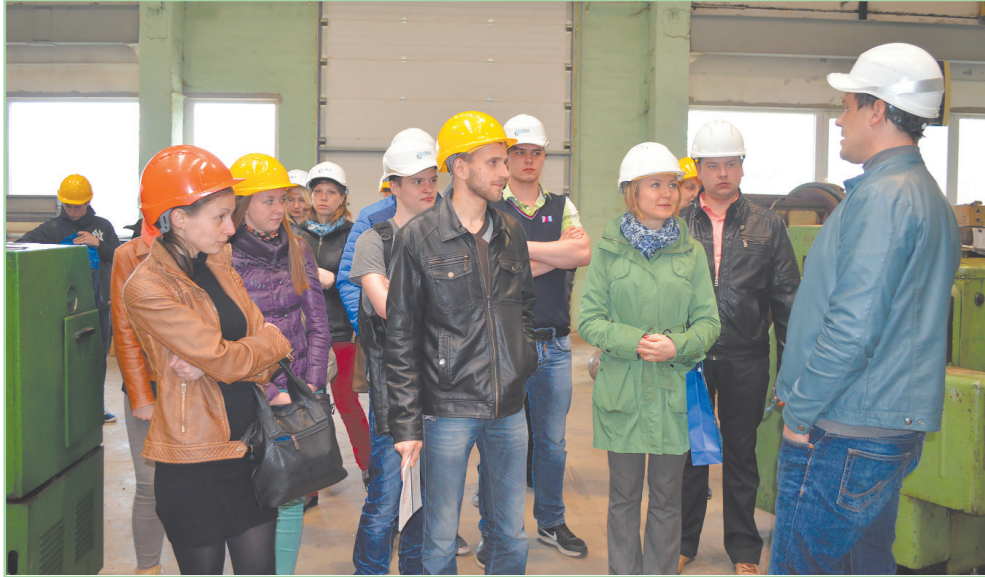
■ Будущие студенты посетили ООО "LīvMet"

Примерно 60 молодых людей 28 апреля пришли на встречу с преподавателями Резекненской академии технологий (РАТ) и студентами, чтобы больше узнать о возможностях с 1 сентября освоить специальность машиностроения в Ливанском филиале Резекненской академии технологий.