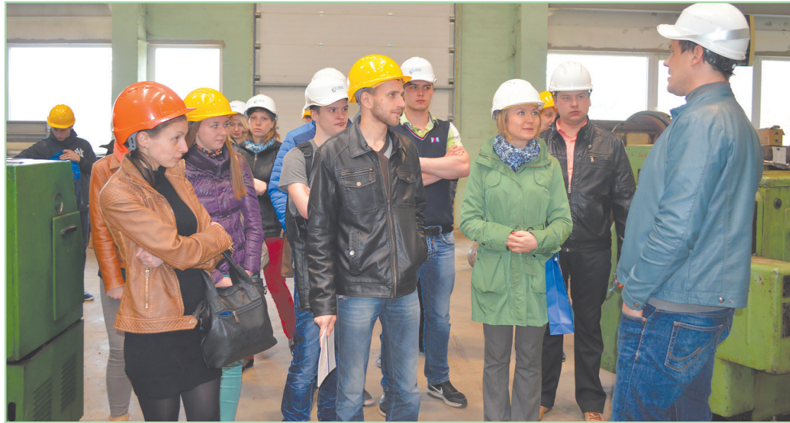
■ Topošie studenti apmeklē uzņēmumu "LīvMet"

Aptuveni 60 jaunieši 28.aprīlī bija ieradušies uz tikšanos ar Rēzeknes Tehnoloģiju akadēmijas (RTA) mācībspēkiem un studentiem, lai vairāk uzzinātu par iespējām no 1.septembra studēt Mašīnbūves un mehatronikas specialitātē Rēzeknes Tehnoloģiju aka-