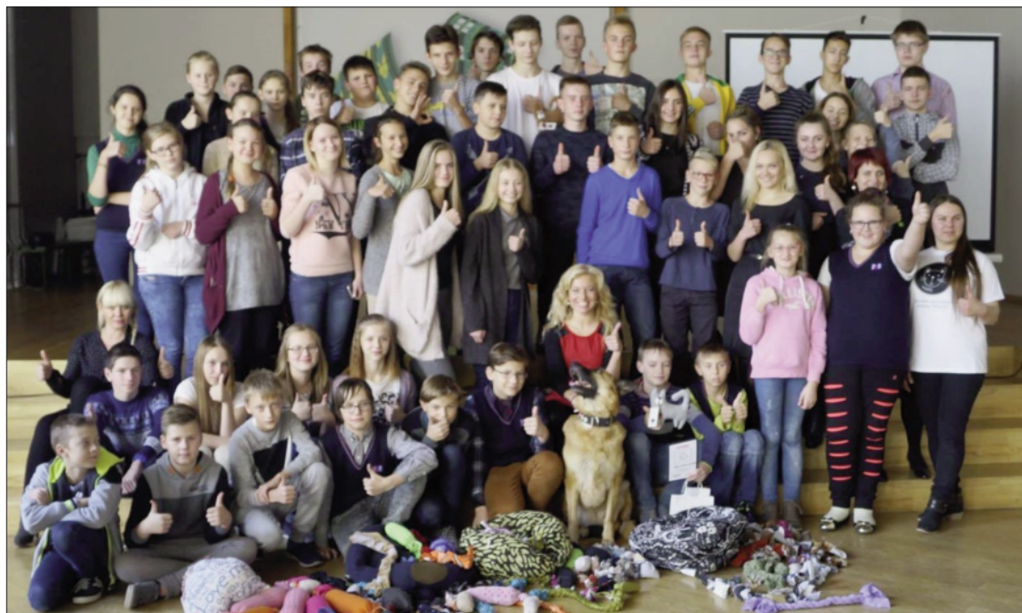
■ Dzīvnieku aizsardzības biedrība saka paldies bērniem, kas piedalījās projekta "Cilvēcības un sirds siltuma mācība" aktivitātēs. Paldies audzinātājiem par atbalstu! Būsim atbildīgi saimnieki!