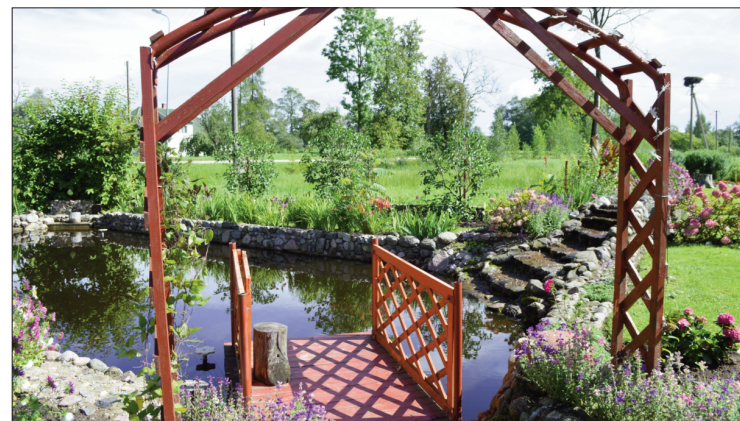
■ Cakulu ģimenes dārzā Rudzātos vērojama liela augu dažādība. Kompozīciju papildina koka arkas un tiltiņi, kā arī puķu dobjus apmales no akmens.

Pasākuma laikā konkursa uzvarētājiem tiks pasniegtas Līvānu domes dāvanu kartes 100 EUR vērtībā un piemiņas balvas, bet nomināciju ieguvēji saņems dāvanu kartes 20 EUR vērtībā un piemiņas balvas. Visiem konkursa dalībniekiem pašvaldība dāvina arī apmaksātu braucienu uz Vislatvijas puķu draugu saietu, kurš notiks nākamā gada 15.jūlijā Raunā. Paldies konkursa atbalstītājiem SIS „Livani Eko Group”.