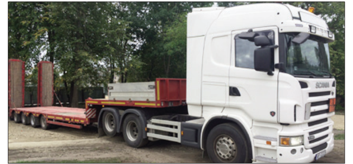
■ Lielgabarīta, negabarīta un dažādas tehnikas transportēšanas pakalpojumi.

Līvānu novada uzņēmums RNS-D Transporting informē iedzīvotājus par jaunu pakalpojuma veidu: lielgabarīta, negabarīta un dažādas tehnikas transportēšanas pakalpojumiem. Vairāk informācijas var saņemt Dzelzceļa ielā 19, Līvānos vai pa tālruni 25442444 un 27877037, kā arī e-pastā: rnsd.transporting@inbox.lv