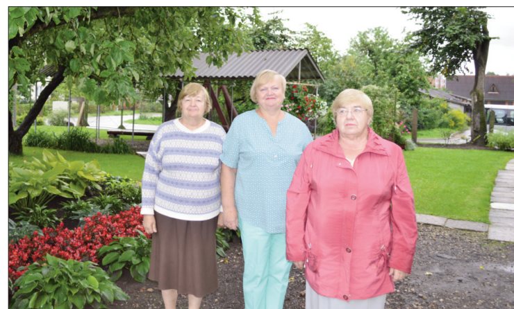
■ Biedrības „Sābri” čaklās saimnieces

Lai novērtētu balkonus un lodžijas, konkursa komisija apmeklēja Līvānu pilsētas daudzdzīvokļu māju pagalmus un četras no balkoniem/ lodžijām izvirzīja dažādām nominācijām. Protams, šādu ziedošu balkonu Līvānos ir daudz vairāk. Paldies visiem saimniekiem, kuru krāšņie “gaisa dārzi” rotā daudzdzīvokļu ēkas.