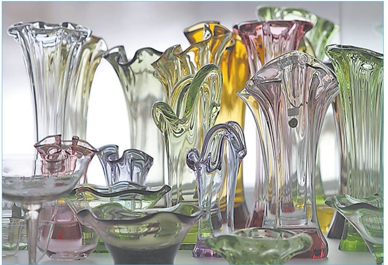
■ Изделия Ливанского стекольного завода - это до сих пор бренд № 1 – Ливан - нашего города.

Художники были многогранными специалистами, ведь, представляя конкретное изделие из стекла и