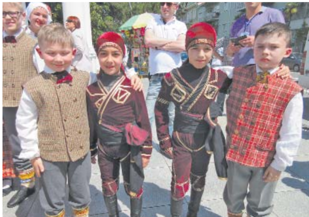
■ Латышские и грузинские дети – каждый со своим национальным культурным и фольклорным богатством!

В конце мая фольклорный ансамбль „Ceiruleits” вернулся из Грузии, где участвовал на XVI международном фестивале – конкурсе „Золотой дельфин – искусство со всего мира”. В конкурсе участвовали 12 стран. Фестиваль – конкурс организовала Грузинская Национальная секция CIOFF в сотрудничестве с Министерством образования, культуры и спорта Аджарской АР и Батумской городской думой. За неделю многое было пережито и увидено.