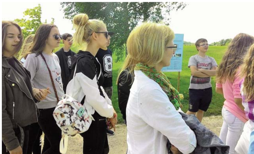
Ученики как приз за хорошие достижения каждый год получают поездку в познавательную экскурсию.

Спасибо всем – и участникам, и встречающим дома! Мы гордимся своими олимпийцами, которые насладились этим днем!