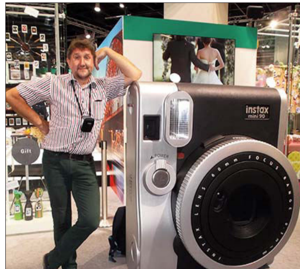
■ 2014. gadā izstādē „photokina” Vācijas pilsētā Ķelnē

visur ir tik skaisti kā Līvānos! Katrā pagastā ir renovēts kultūras nams, kurā vietējie cilvēki var satikties, pavadīt savu brīvo laiku, dziedāt un dejot, un apmeklēt dažādus kultūras pasākumus un koncertus. Protams, esmu gandarīts par sporta vidi Līvānos, kur ikviens var atrast sev piemērotāko sporta veidu un aktīvi pavadīt brīvo laiku.