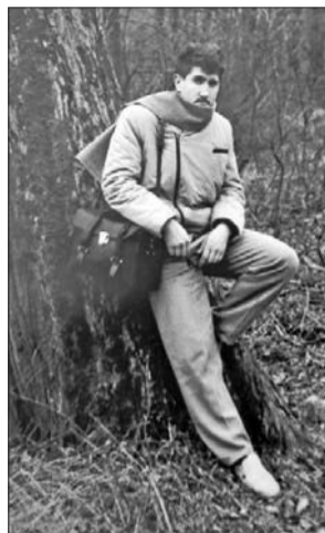
■ 1987. gadā pēc foto-grāfa diploma iegūšanas

Ai, nu ko lai saka? Visi jau mani Līvānos pazīst – gan bērnārznieki un jaunāko klašu skolēni, gan simtgadnieki! Nu labi, domāju, ka šūpulī man ir ielikta lieliska humora izjūta, esmu labsirdīgs, arī slinks, bet slinkums mani virza kustēties un darīt visu tad ātri un labi. Esmu sabiedrīks, atraktīvs, pozitīvs pret dzīves notikumiem un cilvēkiem. Nesaprotu un neatbalstu negatīvismu. Tā jau ir – savu garstāvokli un attieksmi var radīt un veidot tikai tu pats. Ja dari kaut ko, tad dari priecīgi un viegli. Tā es domāju – kāda jēga būt negatīvam, ja jāpaveic, kas jāpaveic! Citi jau arī man teic, ka neesot redzējuši mani nīgru, nomāktu un dusmīgu. Nogurušu, bezspēkā piemigušu – gan. Bet to jau redz tika mana sieva. Es domāju, ja mēs viens pret otru attiektos ar izsmalcinātu vieglumu, tad dzīvot kļūtu daudzreiz patīkamāk visiem. Jā, iespējams, es citus dažreiz arī kaitinu ar savu dzīves moto: "Pasmaidi! Gan jau būs labi!" Un ir! Jo dzīve ir LABA.