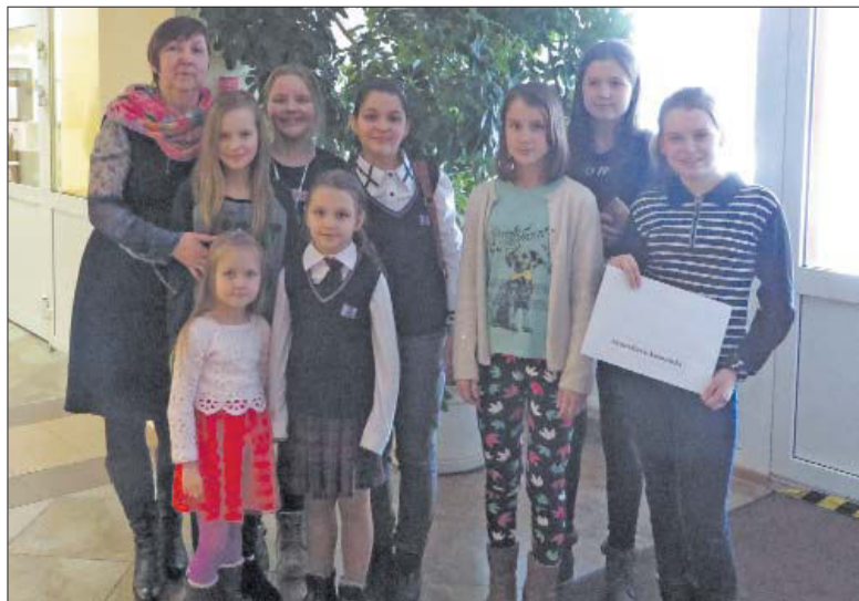
■ Ceļojošās Pūces balvas ieguvēji Jaunsilavu bibliotēkas komanda

Paldies lasīšanas ekspertiem par iesaistīšanos aizraujošajā lasīšanas piedzīvojumā!