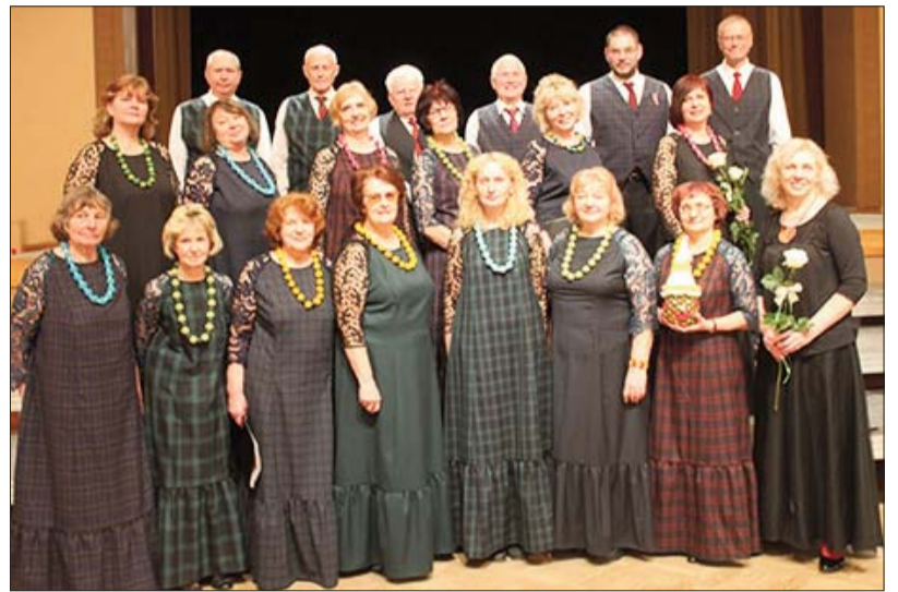
■ 11 марта хор сеньоров „Jersika” в Мадоне выступил в концерте хоров сеньоров „Ceļā uz Dziesmusvētkiem”

Для меня это до сих пор остается секретом, как сеньориты и их рышари в столь раннее утро могут быть такими бодрыми и улыбочивыми. Их жизнерадостность и выдержка пробуждает во мне новые силы, идеи и азарт. Нельзя не заметить, как блестят глаза, и старается каждый хорист, представляя песню. Нельзя не услышать, как летит поток добрых слов и пожеланий. Нельзя не ощутить любовь. Она кидается мою грудь и проскальзывает в сердце. Именно так, как пару дней назад дешевая карамель в