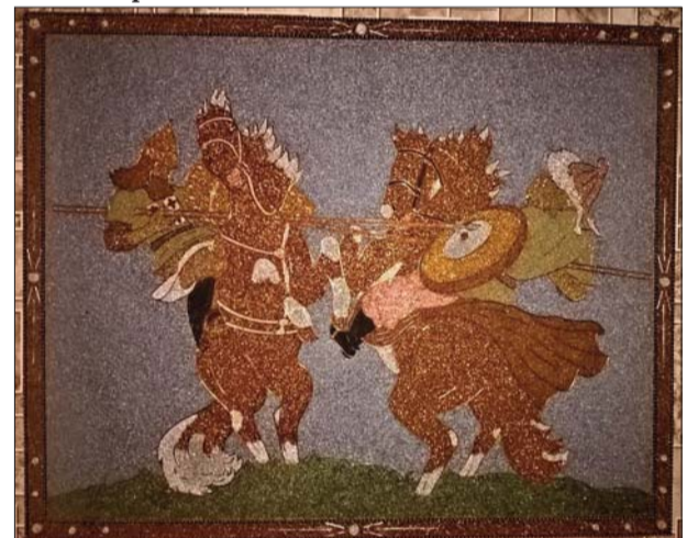
■ Картина – эпизод сражения на войне

Сейчас я в думе участвую в работе Комитета по социальным вопросам, которые также важны и необходимы в бизнесе предпринимателю! Поэтому мне за честь работать в этой сфере, углубляться и узнавать то, что мне еще не известно, и делиться своим опытом, чтобы принимать правильные решения для развития Ливанского края и его жителей. Важно, чтобы наши ливанчане были социально защищены и чувствовали это. И именно это будет способствовать еще большему укреплению и сплочению всех наших жителей Ливанского края.