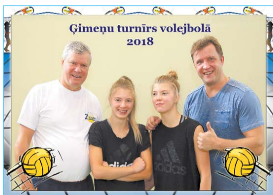
■ 3. vietas ieguvēji – Pfafrodi

Griķu ģimenes vārdā – vēlreiz paldies visiem par jauko dienu! Turpināsim tradīciju un tiekamies atkal nākošgad februārī!