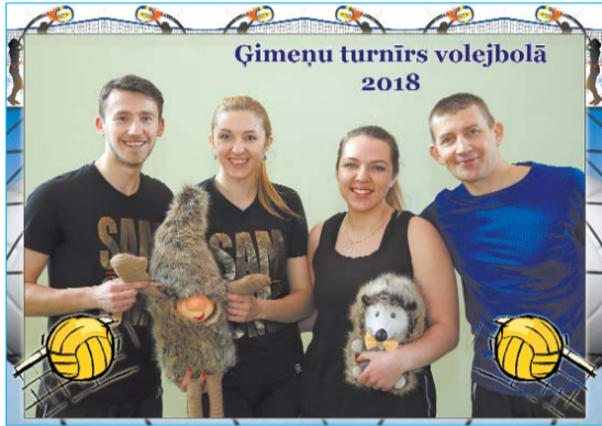
■ 1. vietas ieguvēji – Vilcāni

Septītais “Ģimeņu turnīrs volejbolā” noritēja kā vienmēr – draudzīgā, ģimeniskā atmosfērā un ar veselīgi sportisku ciņas garu. Gandrīz visiem šis turnīrs ir viena no nedaudzām reizēm gadā, kad laukumā iziet šādā ģimeniskā sastāvā – pat trīs paaudžu apvienojumā – baudot īpašas sajūtas! Patiesi prieks par tām ģimenēm, kuras šogad piedalījās pirmo reizi, kā arī tām, kuras bija izveidojušas pilnas ģimeņu komandas (četrniekus).