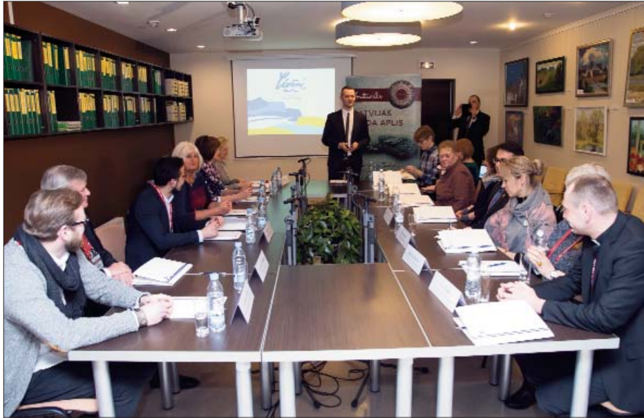
■ Jāņa Magdaļenoka foto

Diskusija “Kur augt? Līvānu novads nākamajā Latvijas 100gadē” pulcēja Līvānu goda pilsoņus, domes deputātus un citus sabiedrībā pazīstamus cilvēkus