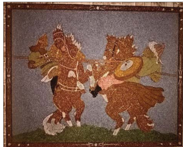
■ Glezna – kaujas aina

Priecē, ka ir sākts ieguldīt līdzekļus rūpniecībā, kas dos jaunas darba vietas, un tas dos iespēju atgriezt jauniešus savā dzimtajā pilsētā, kā arī dos iespēju attīstīt privāto biznesu. Tas viss ir ļoti nepieciešams Līvānu novadam un vēl vairāk mūsu iedzīvotājiem, īpaši jaunajai paaudzei. Tas ir ļoti labi, ja ģimene var gan dzīvot, gan strādāt vienā pilsētā.