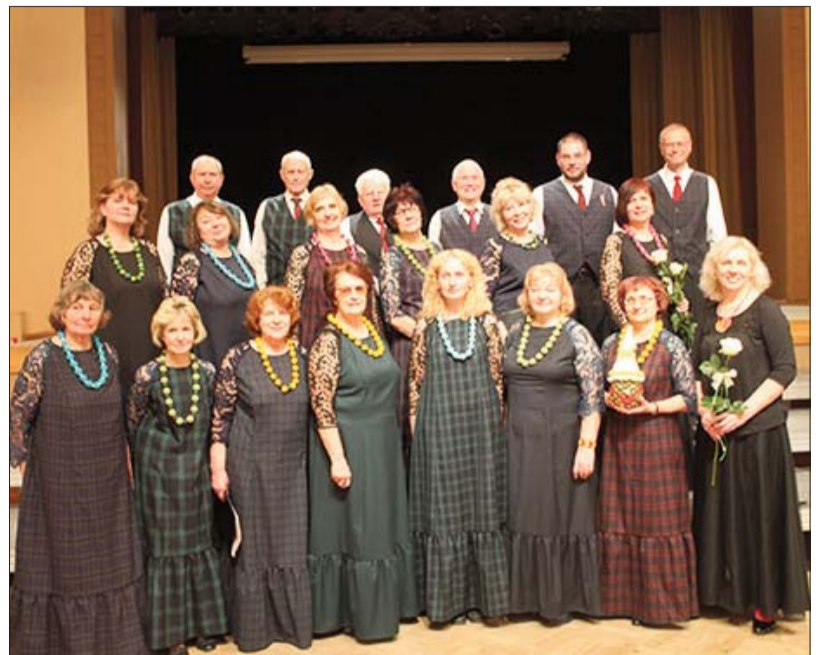
■ 11. martā senioru koris „Jersika” Madonā piedalījās Senioru koru koncertā „Ceļā uz dziesmusvētkiem”

Man tas aizvien ir bijis noslēpums, kā senjoritas un viņu bruņinieki spēj būt tik moži un smaidīgi agrajos rītos. Viņu dzīvesprieks un izturība modina mani jaunus spēkus, idejas un azartiskumu. Nevar neredzēt, kā mirdz acis un cenšas katrs koris, prezentējot dziesmu. Nevar nedzirdēt, kā birst labo vārdu un vēlējumu lietūs. Nevar nejust mīlestību. Tā metas man krūtīs un ieslīd sirdī. Tieši tā, kā pāris dienas atpakaļ lētā karamelē sirmgalvja trīcošajā plaukstā, kad cimojos slimnīcas aprūpes nodaļā. Nemaz nešaubos, ka Dziesmu svētkos