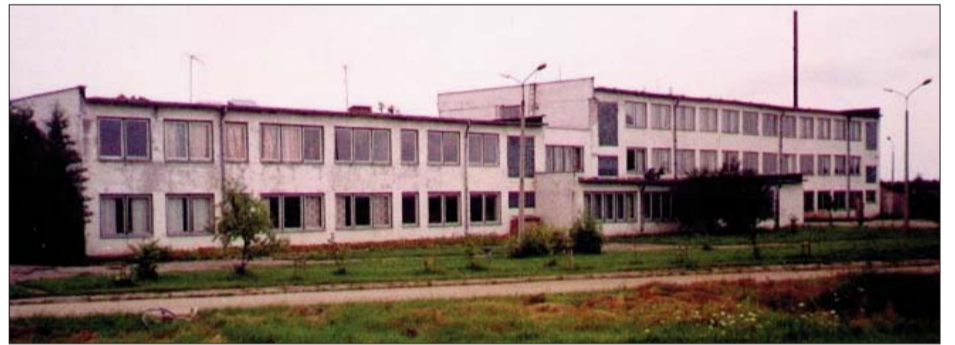
■ Rudzātu vidusskola 1991.gadā

Ar laiku vietējā vara tomēr saprot, ka skolai jābūt pagasta centrā. Rudzātu centrā tiek uzcelta jauna vidusskolas ēka, kuru atklāj 1981.gada 1.septembrī. Skola tiek iesvētīta tikai Atmodas laikā - 1991.g. 21.decembrī (pēc 10 gadiem). To iesvēta prāvests Pēteris Onckulis. Tomēr arī jaunā skola tiek uzbūvēta 1 km attālumā no pag. centra un baznīcas.