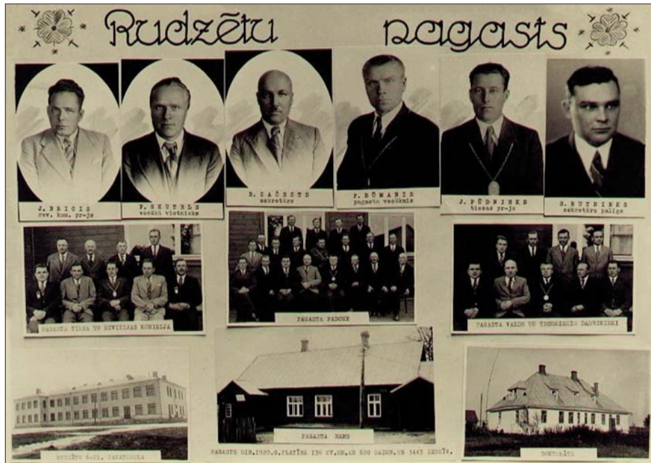
■ Rudzātu pag. vadība, jaunā skola, pagastnams un doktorāts (1938.)

pību, kā arī graudaugu audzēšanu. Pagastā ir samērā daudz bioloģisko saimniecību. Pagasta iedzīvotājiem uz vietas ir pieejami pašvaldības, izglītības, bibliotēkas, kultūras, sociālā dienesta un bāriņtiesas pakalpojumi. Garīgās vērtības kopj Rudzātu Svētā Jēkaba Romas katoļu draudze. Rudzātu pagasta Mālkalnā Līvānu vecdicībnieku draudze sākusi Mālkalnu vecdicībnieku baznīcas atjaunošanas darbus, kur paredzēts izveidot klosteri. Pagastā darbojas trīs veikali. Pagasta teritorijā darbojas ģimenes ārsta prakses vieta, kurā 1 reizi nedēļā pacientus pieņem ģimenes ārste.