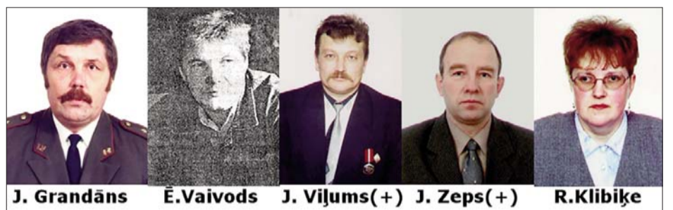
■ Rudzātu pagasta vecākie (valdes priekšsēdētāji) 1991.-2020.