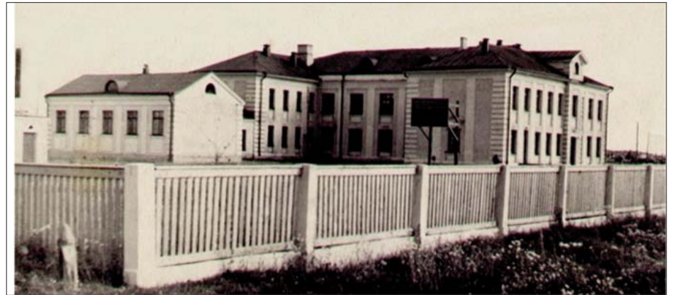
■ Netālu no Skrebeļu purva uzceltā Rudzātu vidusskola (1958.)