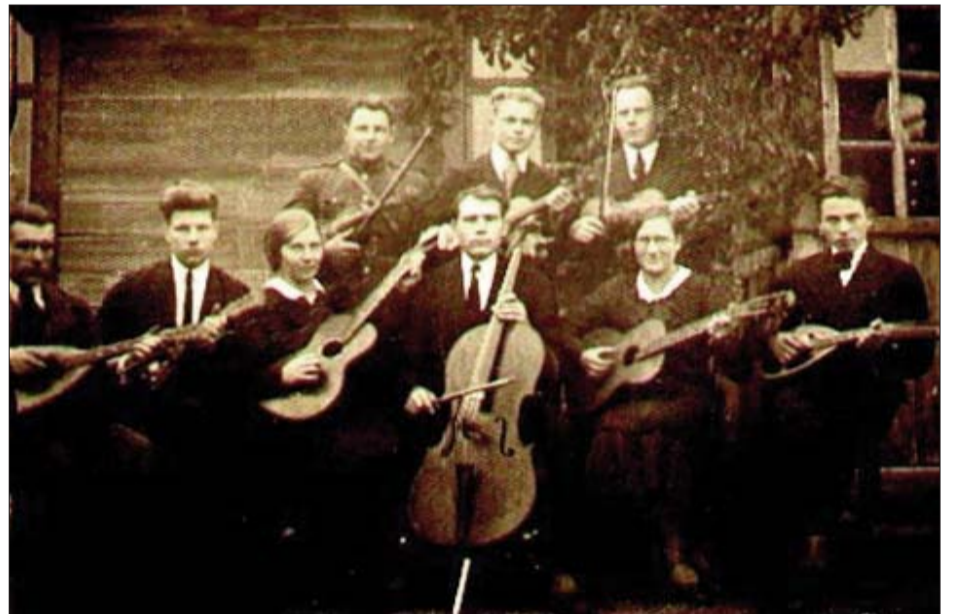
■ Pagasta stīgu ansamblis (1935.)

Vispārējs apskats. Līdz neatkarīgas Latvijas Republikas nodibināšanai 1918.gadā un Rudzātu pag. izveidošanai 1920.gadā nekādas kultūras dzīves pag. teritorijā nav.