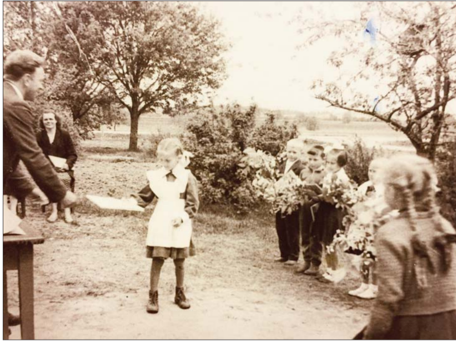
■ Pirmklasnieku uzņemšana 1960.gada maijā

Jau vairāk kā desmit gadus sadarbojamies un regulāri tiekamies, konsultējam viens otru. Tā arvien biežāk gan klātienē, gan neklātienē man sanāk viesoties dzimtajā pusē. Esmu lieciniece viņa jaunāko grāmatu tapšanas un izdošanas ne vieglajam procesam. Priecājos līdzī par viņa darba novērtējumu novadā – apbalvojuma Līvānu Goda pilsonis piešķirumu. Ne mazums enerģijas paņēmis arī pieminekli, ko atklāja Valsts simtgades laikā pie Rožupes pamatskolas. Pirms tam mums bijis daudz sarunu, kur un kādai vajadzētu būt novada Nacionālo partizāņu piemiņas vietai. Dubnas upes krastā pie Rožupes pamatskolas – tā tiešām ir vislabākā izvēlēta vieta.