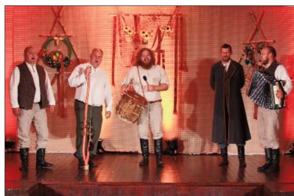
Speciālā nominācija "Vīru dziesmu tradīcijas kopēji latgāliešu folklorā Līvānu novadā" folkloras kopa "Rūžupis veiri" (vadītājs Dainis Paeglis)