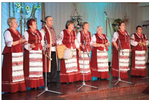
Gada labākais amatiermākslas kolektīvs – slāvu kultūras ansamblis "Uzori", muzikālā vadītāja J.Juzefoviča