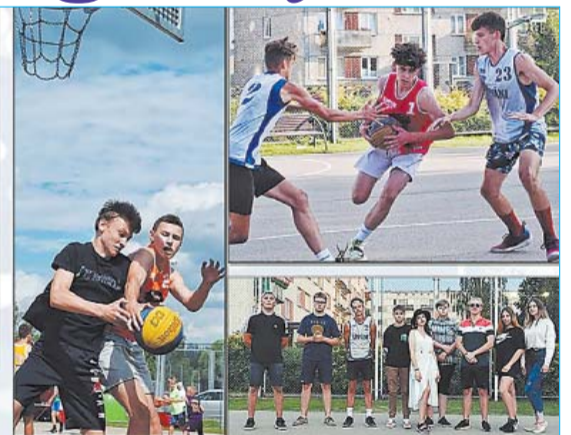
GADA NOTIKUMS LĪVĀNU 3x3 strītbola turnīrs