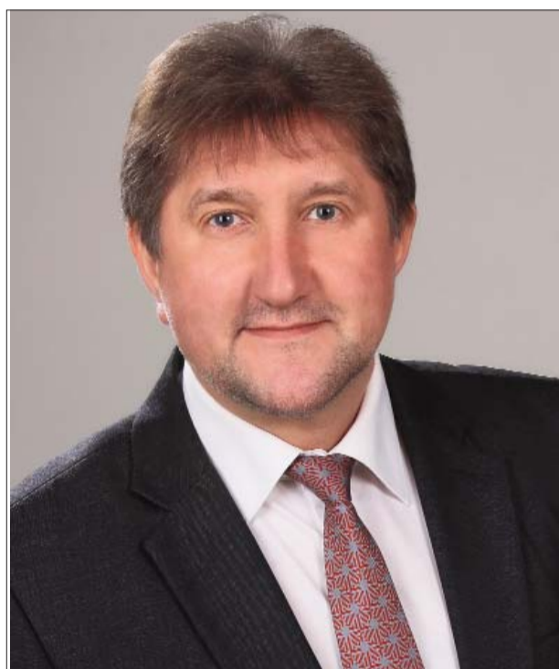
Speciālā nominācija "Līvānu novada kultūras un mākslas norišu fotodokumentētājs 30 gadu garumā" Jānis Magdaļenoks