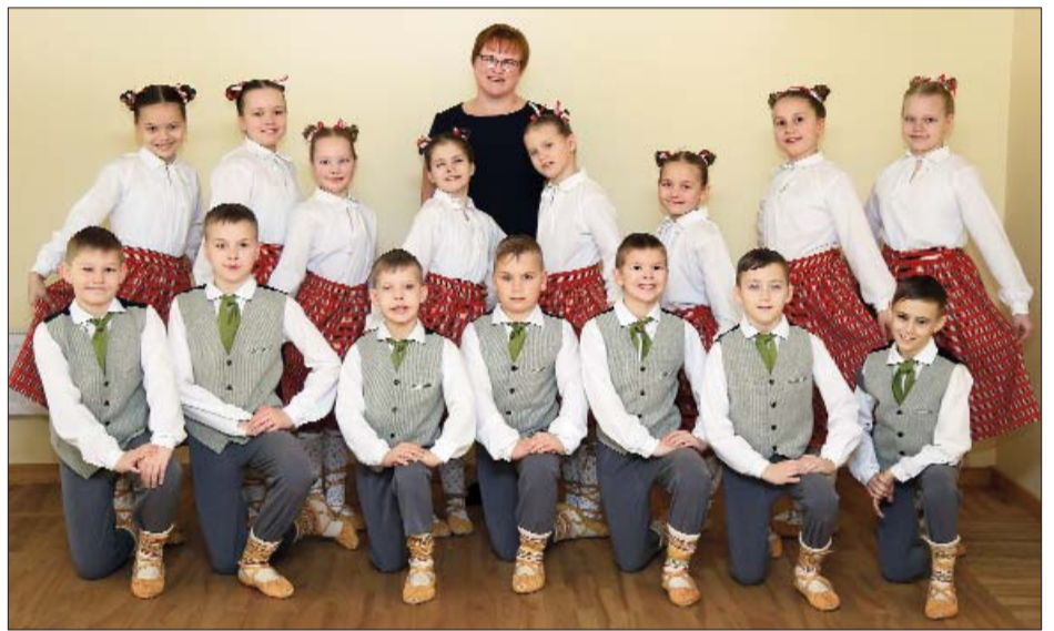
■ Rudzātu SN bērnu deju kolektīvs, jaunākā grupa, vad. I.Bernāne

atkal satikties mēģinājumos. Cītīga darba rezultātā rudenī visi iesaistījās amatiermākslas koncertcikla veidošanā. Pielāgojoties ierobežojumiem, mēģinājumi kādu laiku notika arī individuāli, taču rudens noslēdzās ar virkni jaunu drošības pasākumu, kas kolektīvu darbību pieļauj tikai attālinātā režīmā. Priecē fakts, ka laiks tika izmantots lietderīgi, dažādu projektu un iestādes budžeta ietvaros atjaunojot vai no jauna veidojot tērpus un to daļas. Gribam atzīmēt tos kolektīvus, kuri paši meklējuši iespējas dažādos projektu konkursos papildināt trūkstošos tērpus un veidot jaunus: folkloras kopa “Ceiruleits”, VPKD “Rožupe”, VPKD “Daugavieši”, Līvānu novada KC līnijdeju grupa “Black Coffee”, Rudzātu saietā nama sieviešu vokālais ansamblis. Viens no lielākajiem tērpu projektiem tika realizēts Rožupes KN jauniešu deju kolektīvam “Daidala”, kas ir viens no jaunāka-