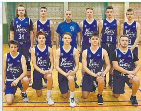
GADA KOMANDA LĪVĀNU BJSS U-17 BASKETBOLA KOMANDA