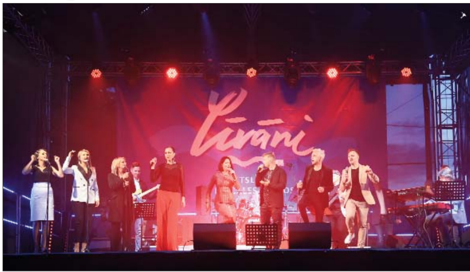
■ Autokonzerts Līvānu Saulrieta pussalā 6.jūnijā – foto J.Magdaļenoks, SIA Minox

2020.gads deva iespēju meklēt, cik tad plaši ir kultūras iespēju apvāršņi. Laikā, kad kādas durvis bija jāaizver, radām iespēju iziet ārpusē. Tā vasaras saulgriežos ar dziesmām un dejām izbraucām pilsētas namu pagalmos, bet visos piecos pagastos skanīgākie Līgo sveicieni izvijās cauri katram ceļa ielokam, piestājot mājās, kur tika piedzīvoti īsta prieka un satikšanās mirklī ar novada iedzīvotājiem. Rudenim tuvojoties paguvām sapulcināt ģimenes uz dažādām sportiskām un radošām aktivitātēm un arī visā novadā parādīt mūsu pašu cilvēku sniegumu amatiermākslas kolektīvu koncertciklā “Laiki nav svarīgi,