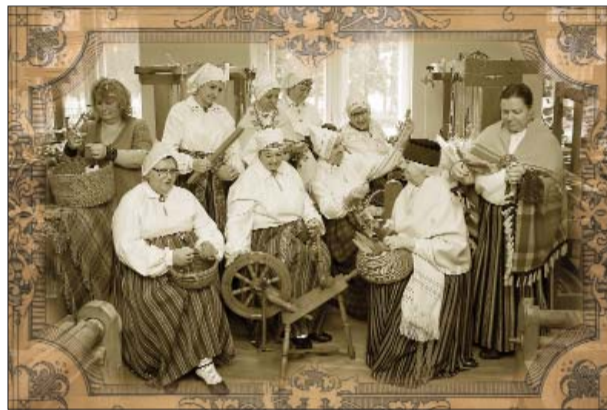
Speciālā nominācija "Latgales sieviešu seno rokdarbu prasmju vairotajas 21.gadsimta modernajā ikdienā" TLM studija "Dubna" (vadītāja Inese Valaine)