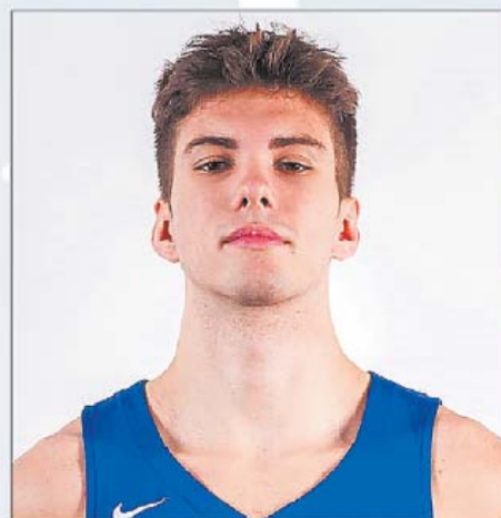
LABĀKAIS SPORTISTS DĀVIS SKREIVERS