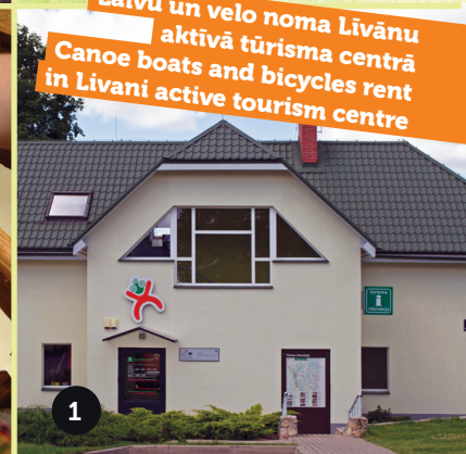
Foto: Jānis Magdalenoks, Ingmārs Zaļmežs, Guna Dimitrijeva, Zita Viļuma, Ilze Vucēna, Sabīne Vucēna